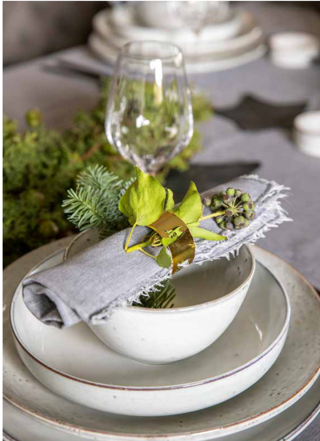
Het grijze, linnen tafelkleed, het servies en het bestek van Broste Copenhagen komen van Bo & Dou Interieur.

“Ja, we kijken hier allemaal al enorm uit naar de feestdagen”