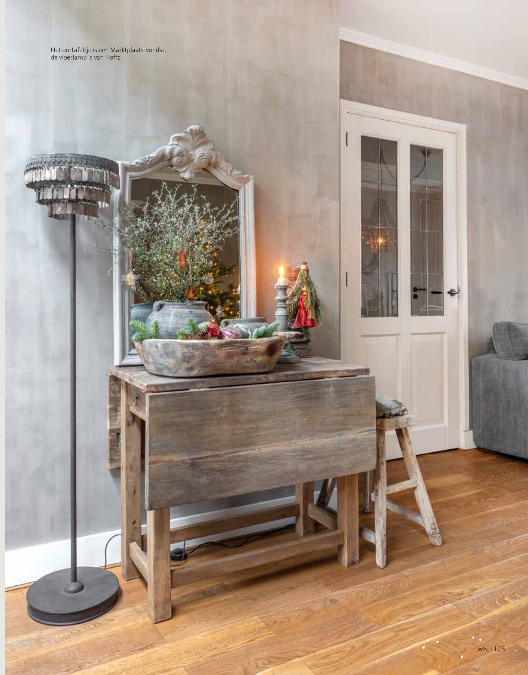
Het oortafeltje is een Marktplaats-vondst, de vloerlamp is van Hoffz.