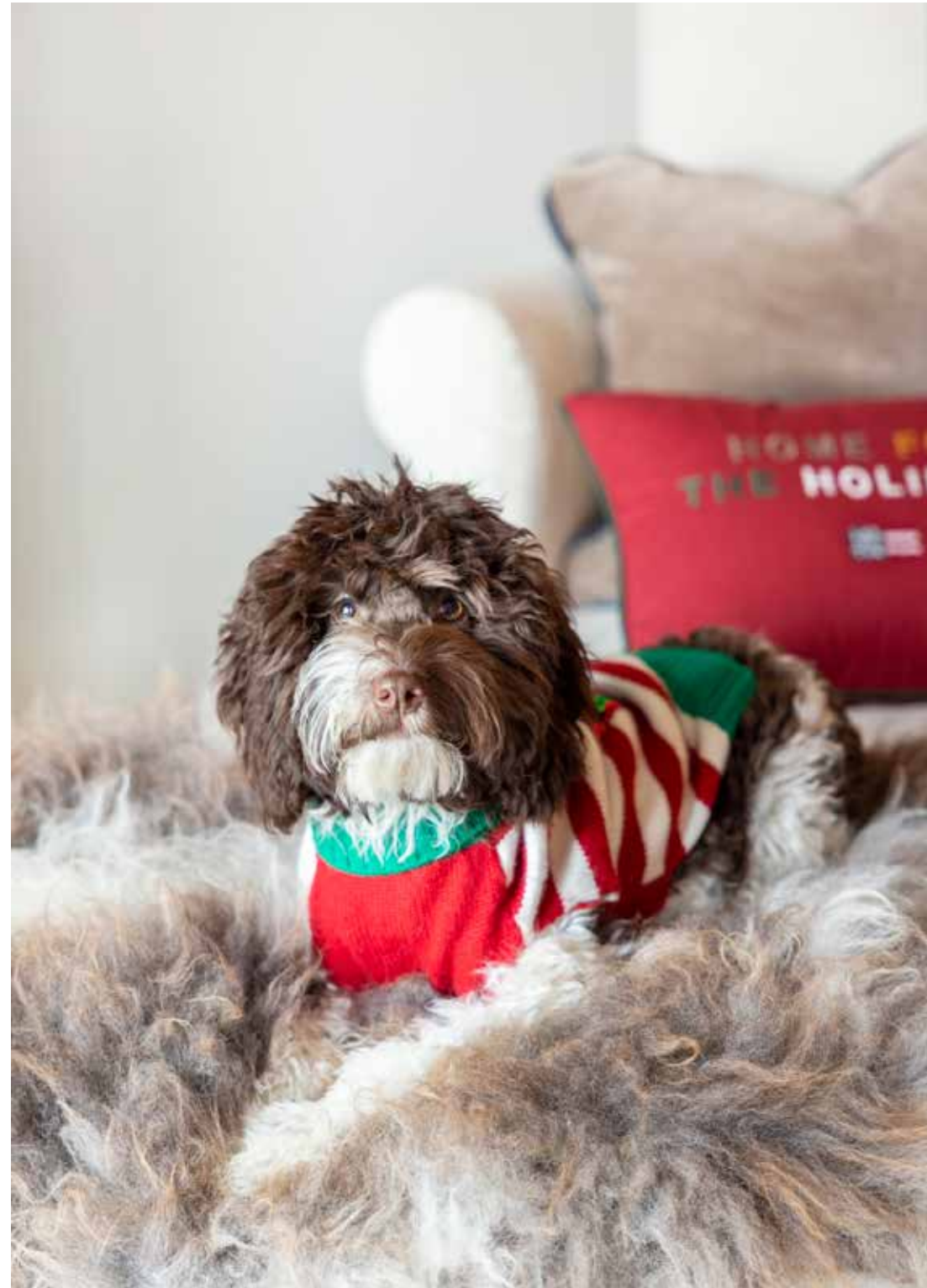
Ook hond Guusje is helemaal in kerstfeer.

“Stef en ik vinden het fijn dat we onze eigen droomsfeer hebben kunnen maken”