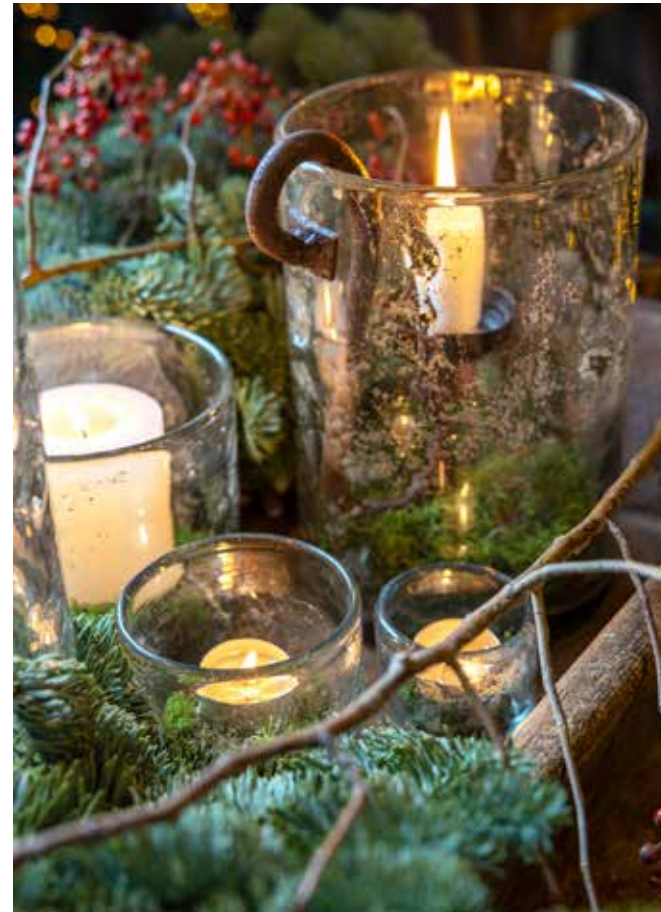
Het witte sterrenschachtje komt van Riviera Maison. De glazen windlichten van Puur Wonen staan in een oude, houten trog (via Wonen & Atelier by Jeanien).

“De kleuren op de wanden zijn helemaal doorgetrokken, wat zorgt voor rust en eenheid”