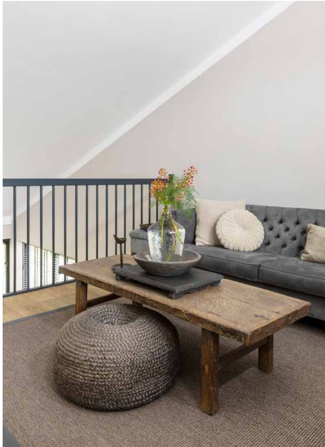
De bank op de bovenste verdieping is meegekomen uit het vorige huis. Uit de collectie van Olāv Home. De kussens komen van Oud Nieuws Wonen. De poef en de accessoires zijn van Hoffz.

“In onze vorige woning hadden we een interieur dat veel landelijker was, maar hier hebben we echt wel wat eigentijds gekozen”