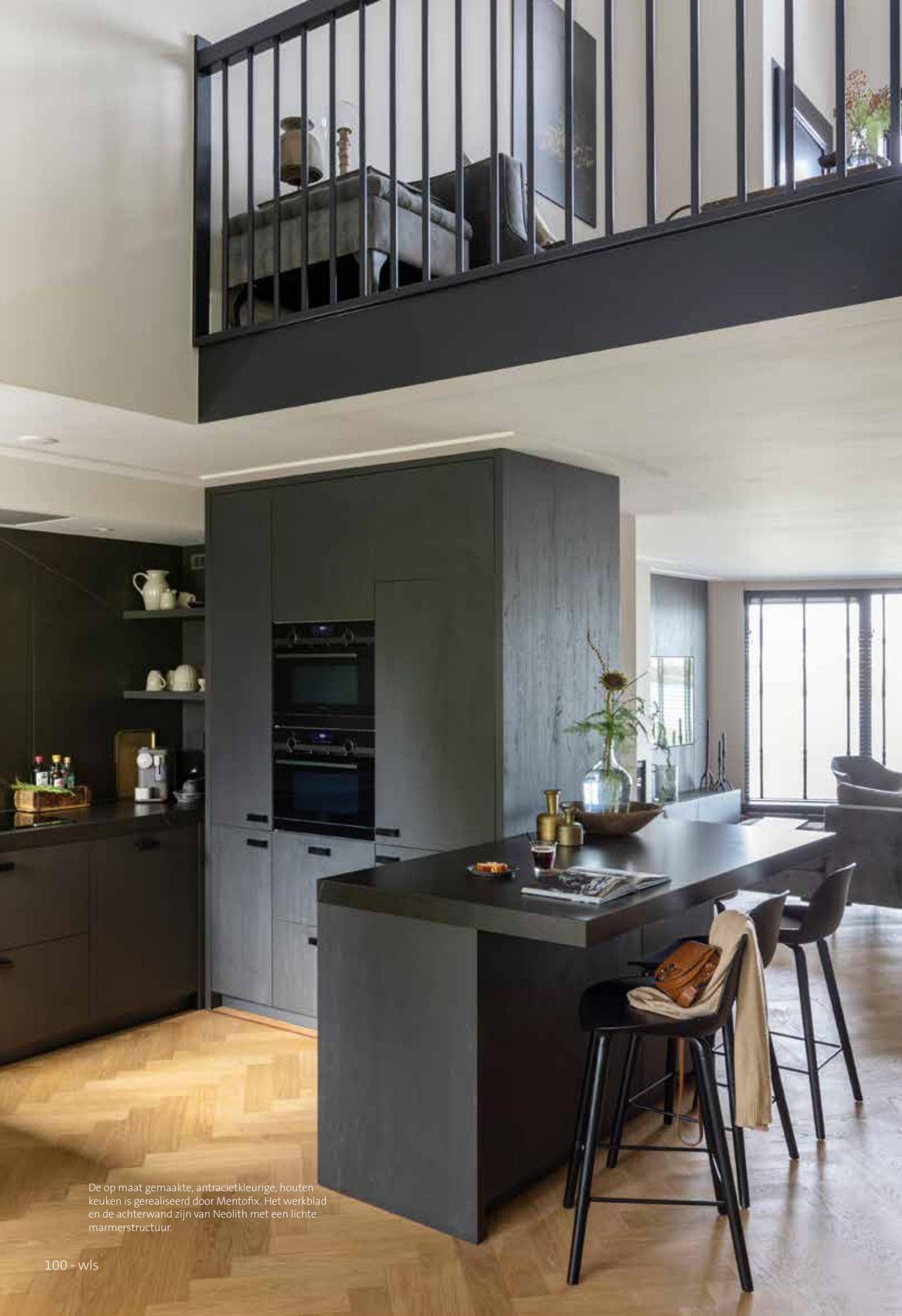
De op maat gemaakte, antracietkleurige, houten keuken is gerealiseerd door Mentofix. Het werkblad en de achterwand zijn van Neolith met een lichte marmersstructuur.