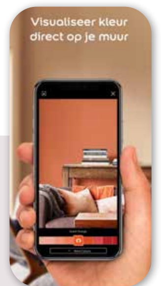
Flexa Visualizer App, verkrijgbaar in de App Store

De apps Flexa Visualizer App en Graham & Brown App kunnen een gekozen kleur of patroon in je eigen interieur visualiseren. Zo zie je meteen hoe de kleur ongeveer uitpakt in de ruimte en of het samengaat met de rest van je interieur. Wie op zoek is naar verfkleuren uit inspiratiebeelden, kan aan de slag met de Histor My color app. Upload een beeld en de app maakt de vertaalslag naar een verfkleur en laat bijpassende kleuren zien. Dit beeld kan van alles zijn: van een foto van een ondergaande zon tot de kleur van je favoriete lippenstift.