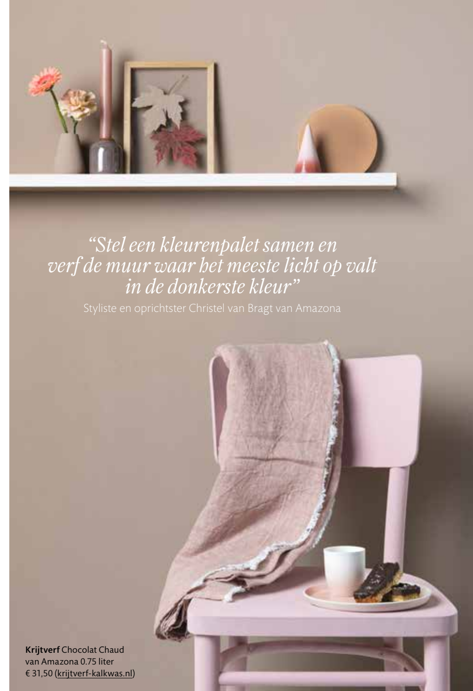
Krijtverf Chocolat Chaud van Amazona 0.75 liter € 31,50 ( krijtverf-kalkwas.nl )

Moodboard voor de badkamer met materialen en kleurstaal. Kleuren Tarte (betonlook), Fuzzy en Screen (krijtverf) 1 liter € 31,95 ( betonlook.nl )