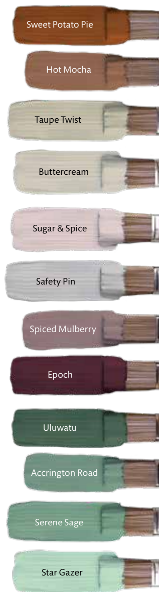
Graham & Brown, prijs verschilt per verfsort ( grahamandbrown.com )