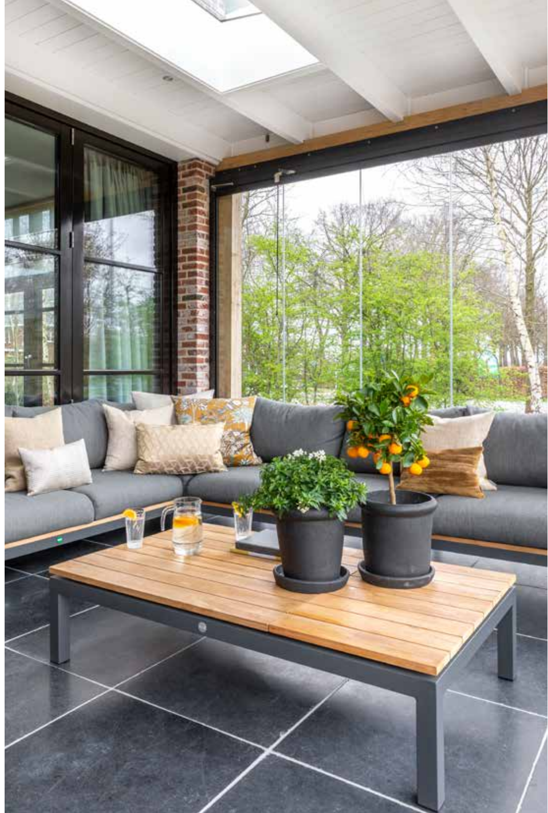
Onder de veranda staat loungeset Memphis van Suns met sierkussens van Violier at Home. De planten en het sinaasappelboompje zijn gekocht bij De Violier in Veenendaal.