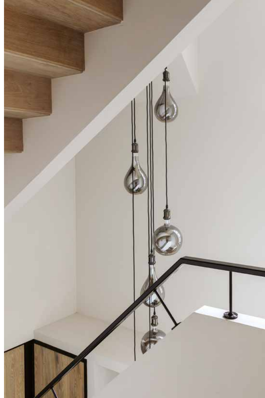
De hanglampen Gracio Bulbs op de overloop zijn van Duran Interiors, via Violier at Home.

“DE KLEURENCOMBINATIES, DE VERLICHTING, DE SFEERVOLLE HOEKJES ... HET KLOPT HELEMAAL!”