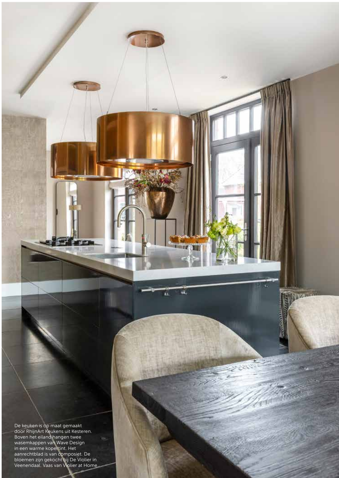
De keuken is op maat gemaakt door RhijnArt Keukens uit Kesteren. Boven het eiland hangen twee wasemkappen van Wave Design in een warme kopertint. Het aanrechtblad is van composiet. De bloemen zijn gekocht bij De Violier in Veenendaal. Vaas van Violier at Home.

“WE WILDEN EEN SFEERVOL HUIS, RUIM GENOEG VOOR ONS GEZIN, MAAR NIET ZO GROOT DAT WE ONS VERLOREN ZOULDEN VOELEN”