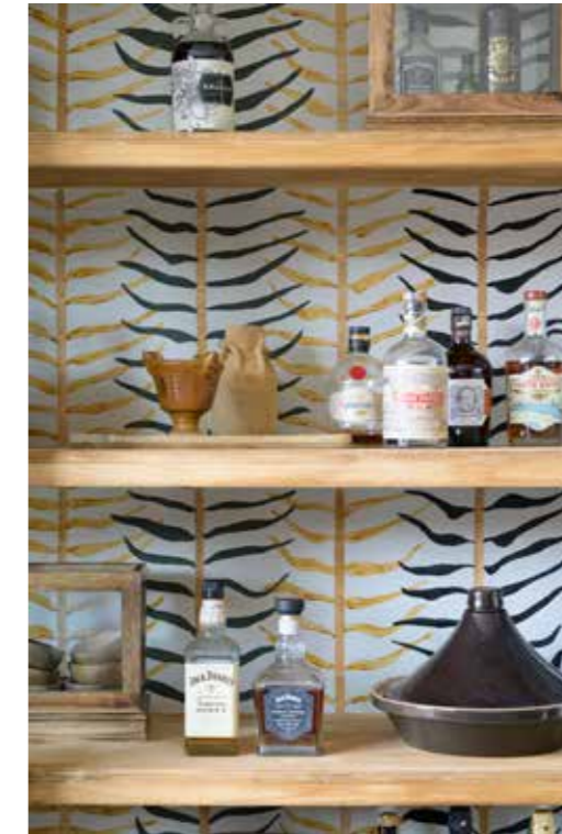
< Zelfontworpen vitrinekast met beschilderde achterwand. Kubusvitrines Casa Vivante. Tajine cadeau gekregen.

"Op straat, in Parijs, vonden we de ramen voor de vitrinekast"