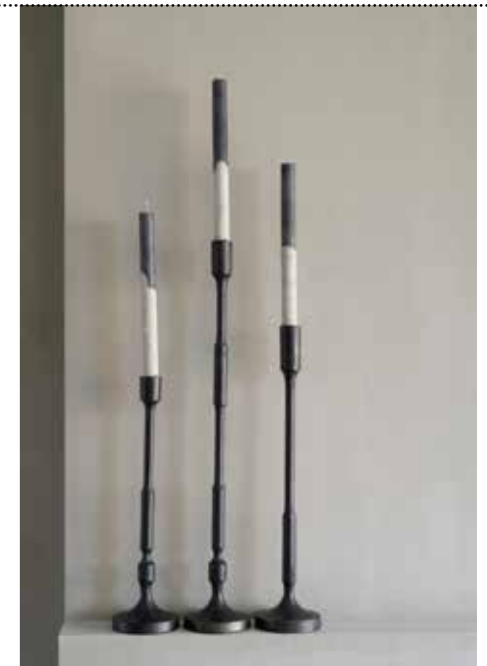
▲ Kandelaars Casa Vivante.