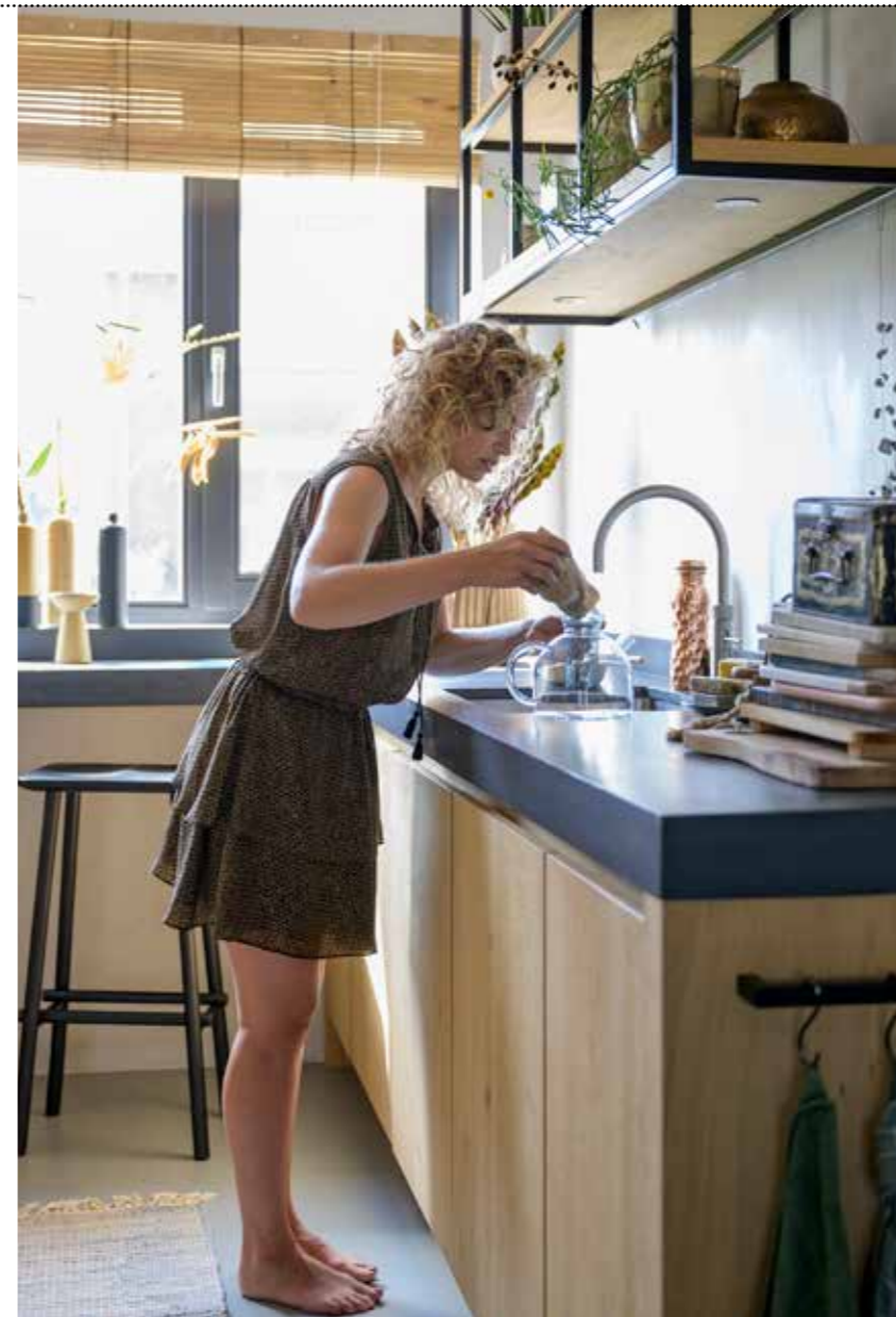
< Metalen hangkast met ledlampen eigen ontwerp via Van Lieshout keukens & interieur. Werkblad Beal.