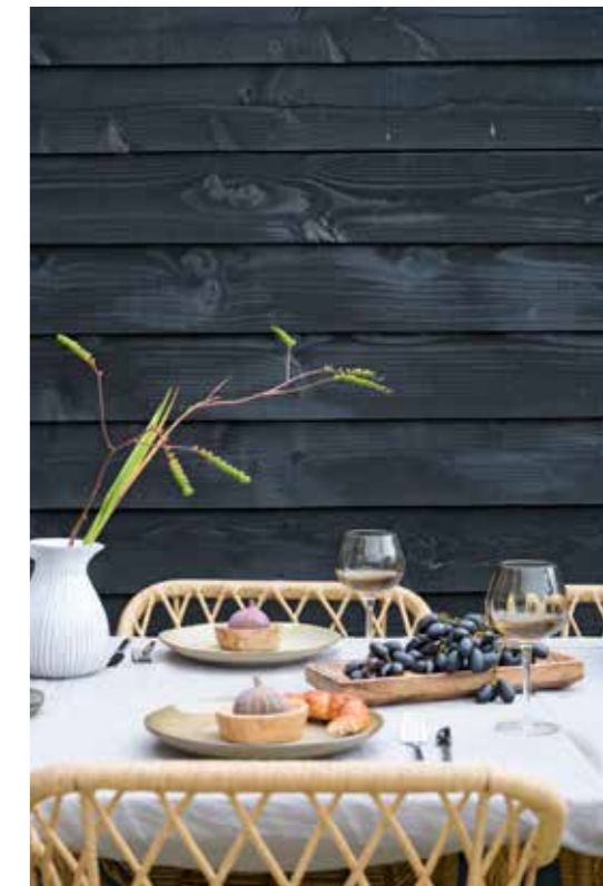
▲ Rabatdelen behandeld met Remmers Induline gw-310. Stoelen en borden Mica Decorations. Overig herkomst onbekend.