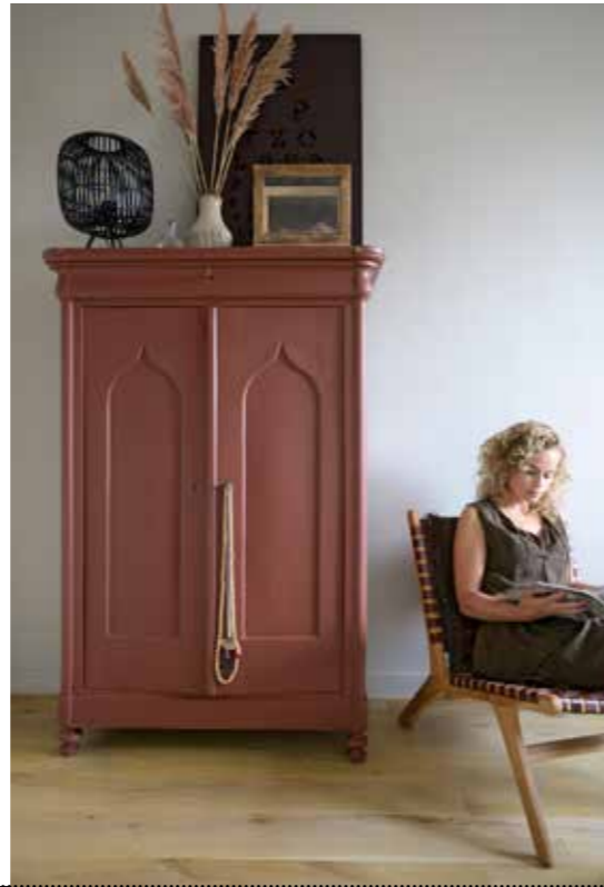
▲ Vintage linnenkast, geverfd in steenrood PPG16-08 van Sigma. Lamp Deens. Wit vaasje cadeau gekregen. Letterbak en kubusvitrine Casa Vivante. Fauteuil Mica Decorations.