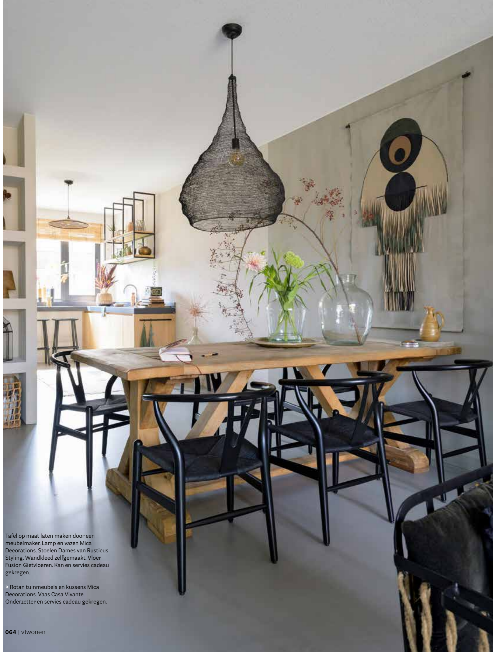
Tafel op maat laten maken door een meubelmaker. Lamp en vazen Mica Decorations. Stoelen Dames van Rusticus Styling. Wandkleed zelfgemaakt. Vloer Fusion Gietvloeren. Kan en servies cadeau gekregen.