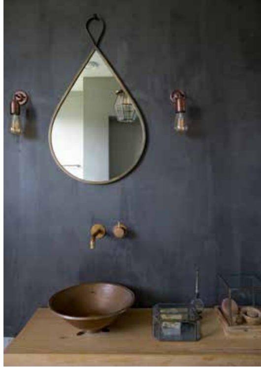
▲ Badkamerwand kleur Graphite met zeer matte vernis Carte Colori. Spiegel Casa Vivante. Wandlampen Etsy. Wastafel op maat gemaakt door een meubelmaker. Kraan in aged brass Hotbath. Wasbekken Sahara Shop. Vitrines Casa Vivante.