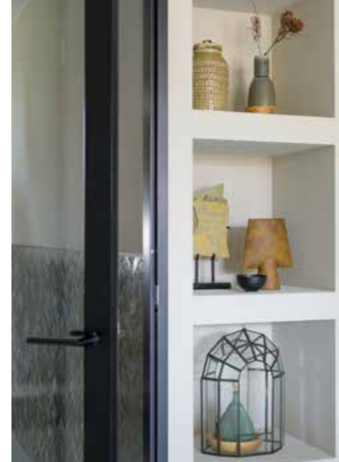
▲ Vakkenkast zelf ontworpen. Herkomst vazen bovenin en zwarte kom onbekend. In het midden stukken natuursteen en vaas Casa Gitane. Onderin terrarium Casa Vivante. Zelliges in de hal Designtegels.