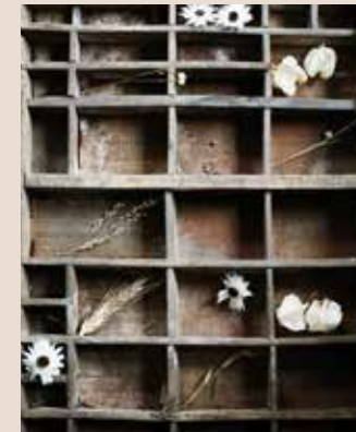
Vintage letterbak (89 euro, floorabella.com )