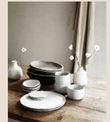
Krijtwhite vaasjes (29,50 en 49,50 euro), klein onderbordje (8,50 euro), wit bord (39,50 euro), witte mok (12,50 euro, alles ateliernaturalart.nl ), antieke houten borden (vanaf 35 euro, floorabella.com ), houten tafel (prijs op aanvraag, achterhuis.nl )