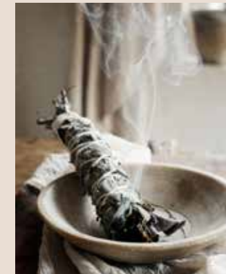
Stenen schaal (45 euro), bloembak (85 euro, beide floorabella.com )