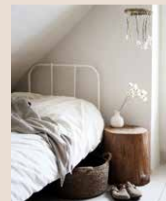
Handgemaakte mand (vanaf 95 euro), teakhouten boomstamtafeltje (225 euro), linnen badlaken (75 euro, alles floorabella.com ), handgemaakt krijt wit vaasje (49,50 euro, ateliernaturalart.nl ), gedroogde en gebleekte Bougainvillea (14,95 euro, style-rustique.nl )