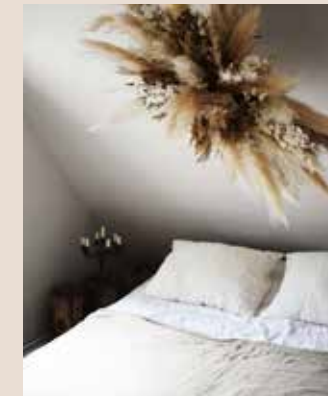
Boomstammetje (65 euro per stuk), linnen beddengoed van Society Limonta (prijs op aanvraag, alles floorabella.com ), wolk van gras (prijs op aanvraag, style-rustique.nl ), linnen plaid (229 euro, hkliving.nl )