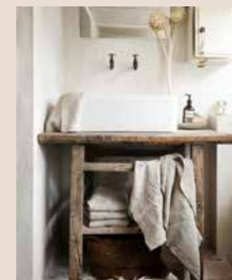
Linnen badlaken (75 euro), stenen zeepkom (45 euro), handgemaakte manden (vanaf 95 euro, floorabella.com ), viltenschapenvacht (85 euro, alles floorabella.com ), gebleekte artisjok (24,50 euro per twee takken, style-rustique.nl )