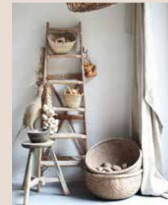
Vintage handgemaakte manden (84 euro per stuk), houten kruk (125 euro), houten kom (45 euro, alles floorabella.com )