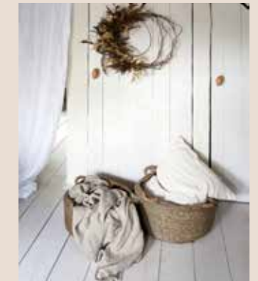
Linnen gordijn Snow White (94,95 euro, casacomodo.nl ), linnen plaid (229 euro, hkliving.nl ), handgemaakte manden (vanaf 95 euro, floorabella.com ), krans (prijs op aanvraag, style-rustique.nl )