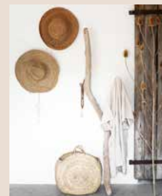
Disteltak (45 euro), vintage Franse linnen jurk (vanaf 189 euro, beide floorabella.com )