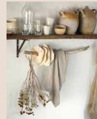
Handgemaakte aardewerken mokken (vanaf 25 euro), handgemaakt waterglas (15 euro), linnen theedoek naturel (45 euro), aardewerken wijnbeker (22,50 euro), houten kommen (15 euro, alles floorabella.com ), XL touwtas van Bilum (118,99 euro, style-rustique.nl )