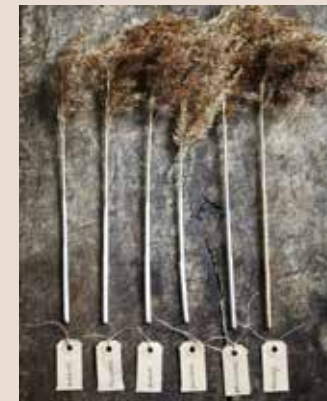
Verfset met 3 proefpotjes (3,95 euro, cartecolori.nl )