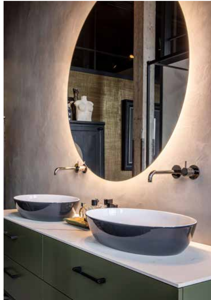
Op de vloer van de badkamer en suite liggen dezelfde Portugese tegels van Floorz als in de keuken. Er is voor betonstuc gekozen voor op de wanden. De douche, de kranen en de grote ronde spiegel komen van De Bruin Sanitair. Het wastafelmeubel is van Villeroy & Boch.