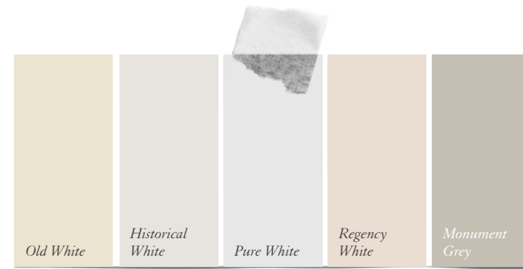
(Painting the Past)