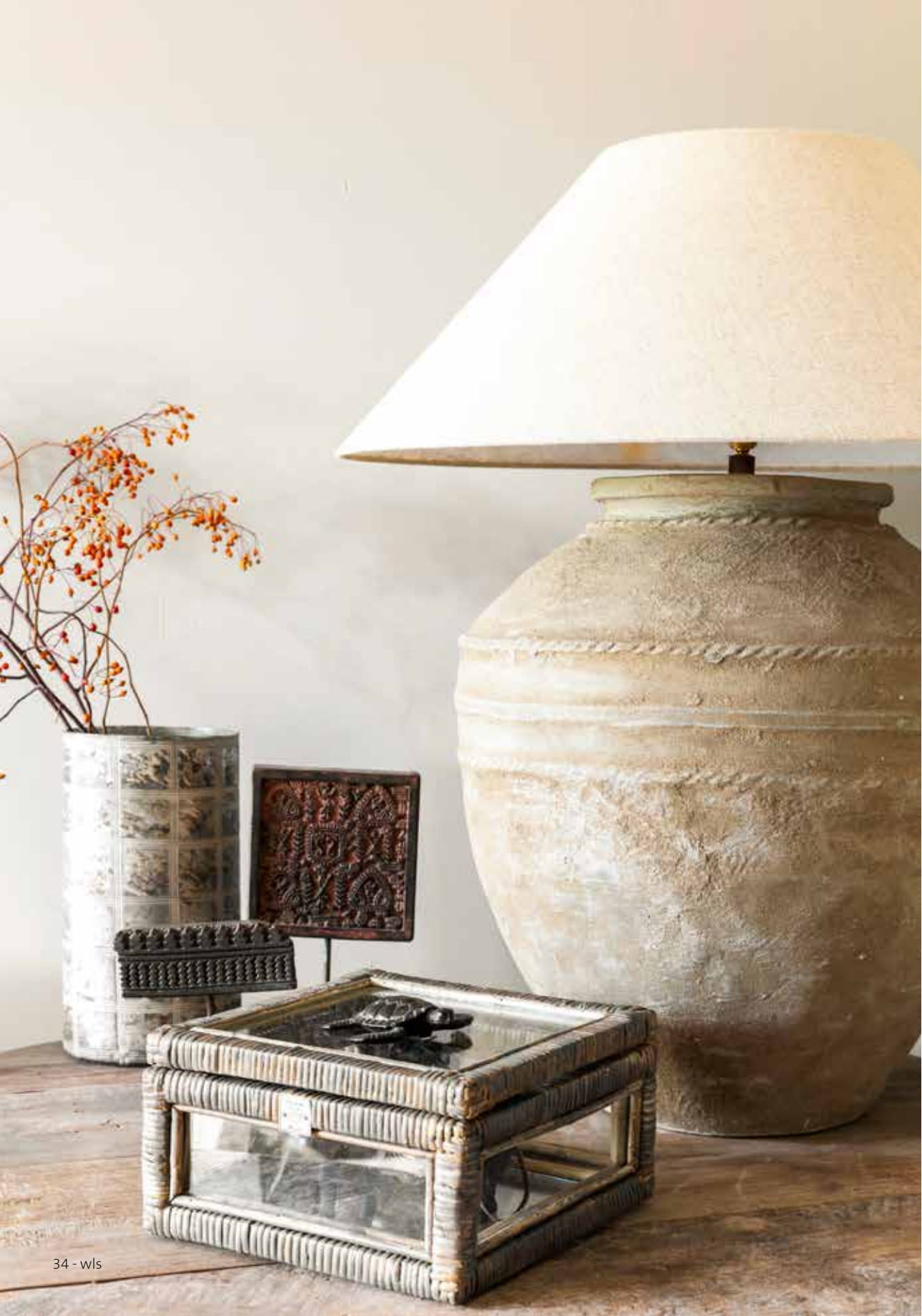
© Anneke Cambon, verf in de kleur Khaki van Painting the Past

WIT IS EEN WONDERLIJKE KLEUR. DANKZIJ DE VELE TINTEN EN NUANCES KUN JE ER ALLE RICHTINGEN MEE UIT, VAN EEN ZACHT TON-SUR-TON TOT EEN KRACHTIG ZWART-WITCONTRAST.