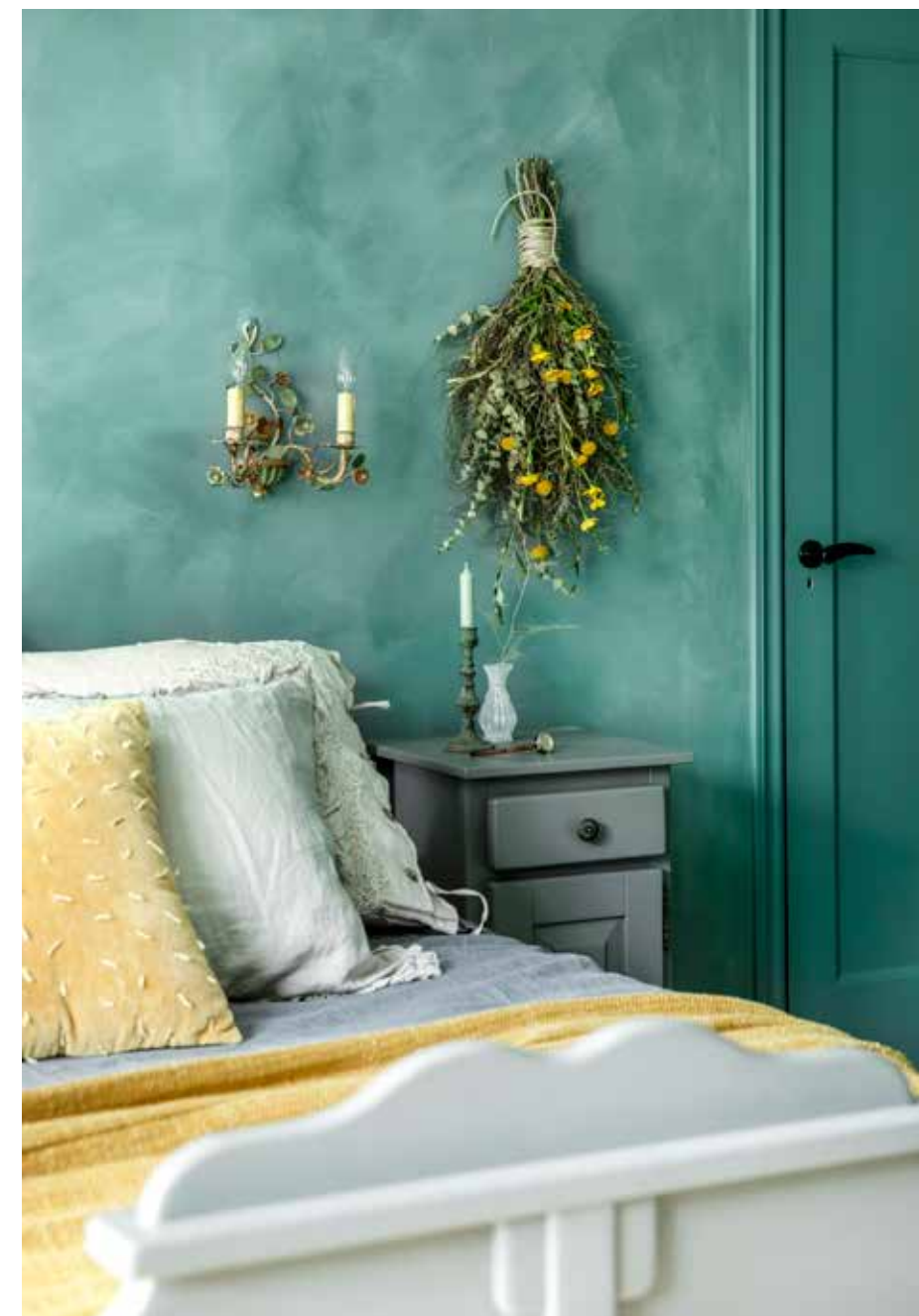
© Peggy Janssen, realisatie Woonwinkel De Potstal; verf op de muur: kalkverf Blue Reef van Pure & Original