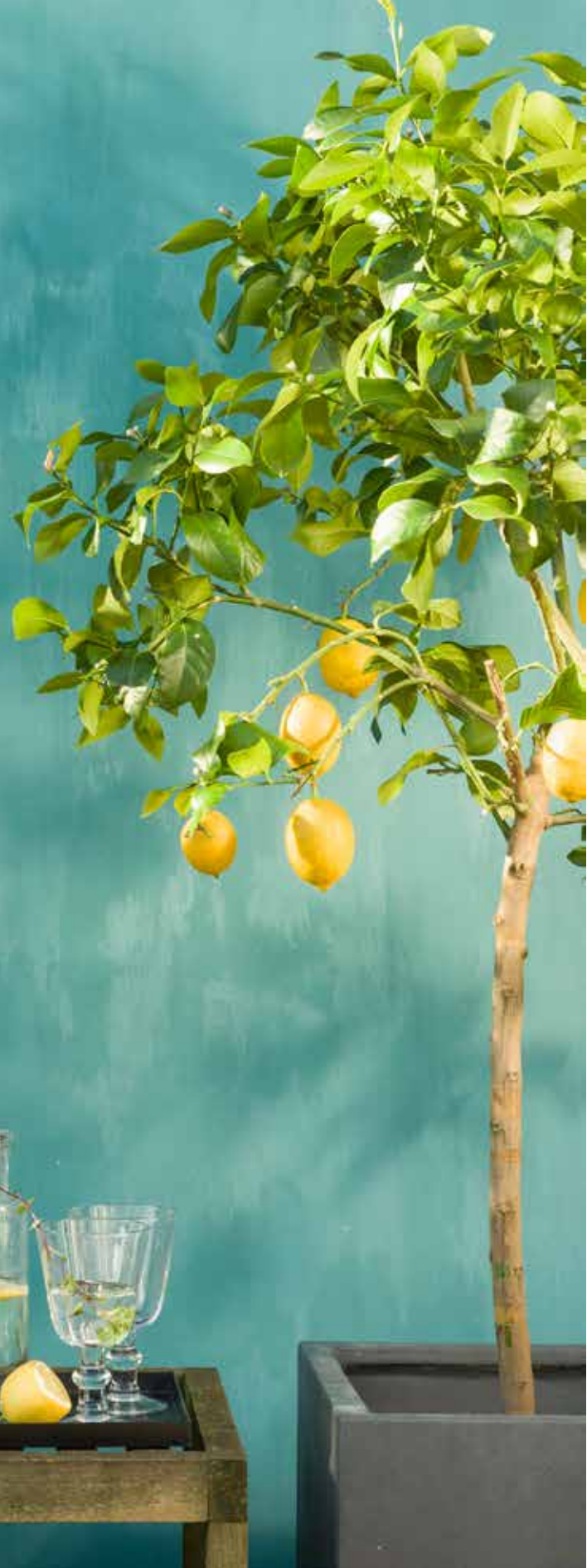
© Carte Colori, kleur Menta uit de Folclore-collectie