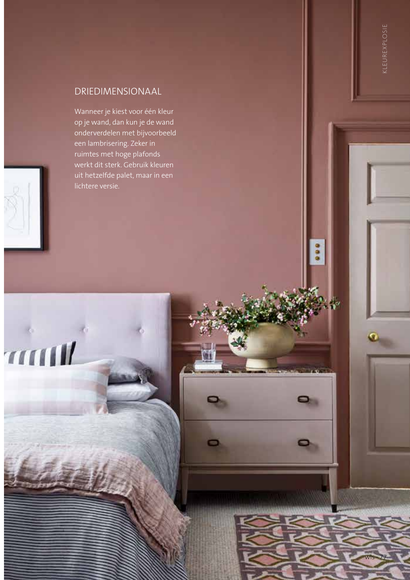
© Little Greene, kleuren Nether Red 315 en French Grey - Dark 163

Wanneer je kiest voor één kleur op je wand, dan kun je de wand onderverdelen met bijvoorbeeld een lambrisering. Zeker in ruimtes met hoge plafonds werkt dit sterk. Gebruik kleuren uit hetzelfde palet, maar in een lichtere versie.