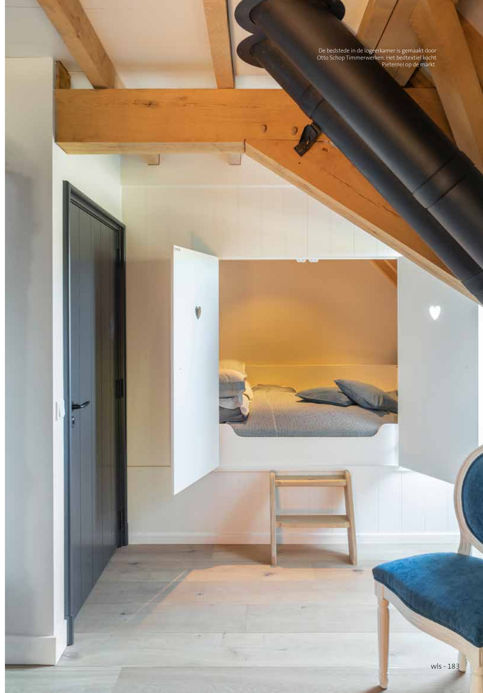
De bedstede in de logeerkamer is gemaakt door Otto Schop Timmerwerken. Het bedtextiel kocht Pieternel op de markt.