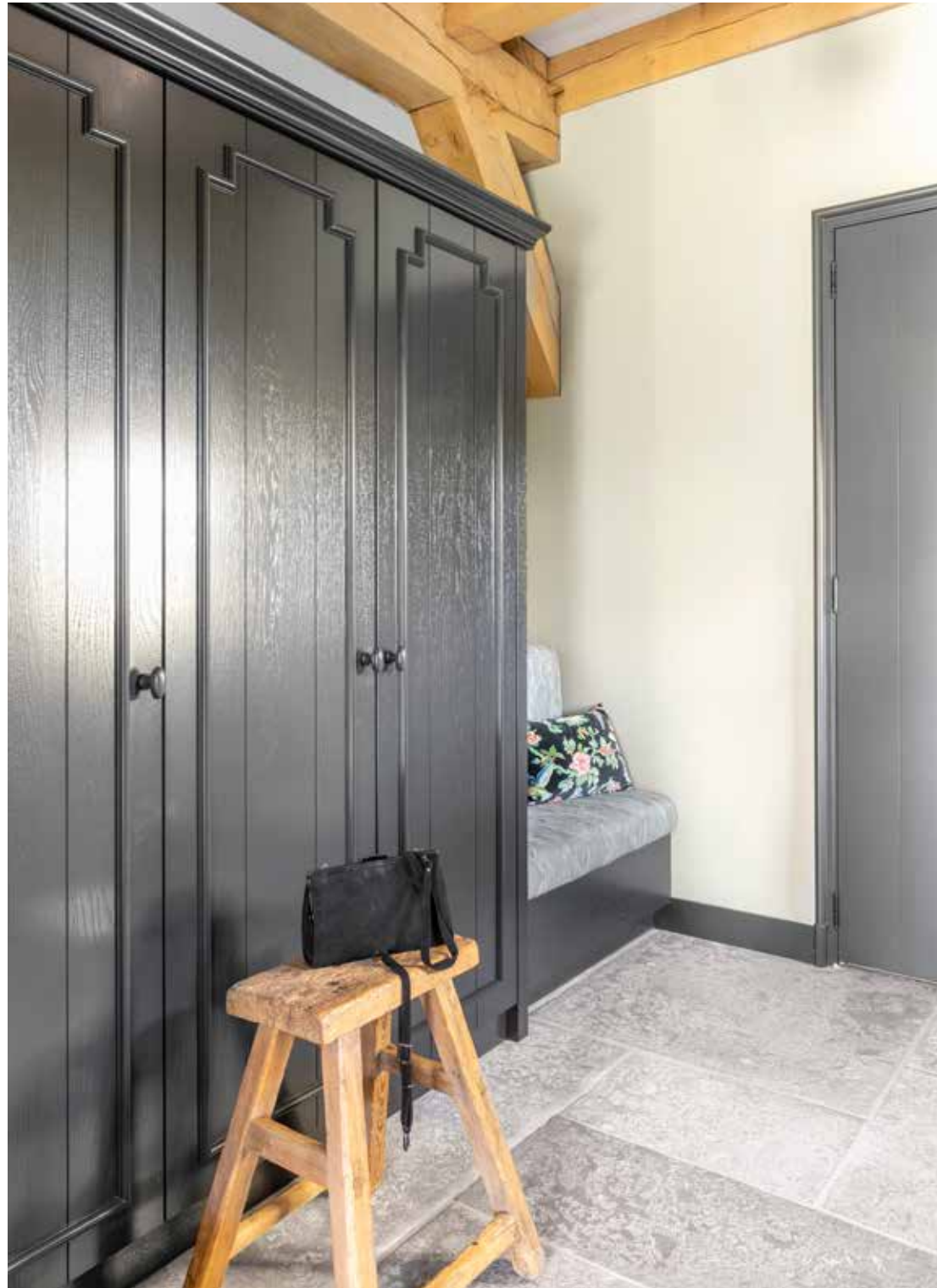
De kastenwand in de entree is gemaakt door Otto Schop Timmerwerken. Op de vloer liggen Castle Stones model Loft, gekocht bij en gelegd door Kleur & Sfeer. Het krukje is van De Bongerd. De entree is geverfd in de kleur Eucalyptus van Carte Colori.

“Omdat wij hopen hier heel lang te kunnen wonen, hebben we ons huis helemaal gelijkvloers laten bouwen”