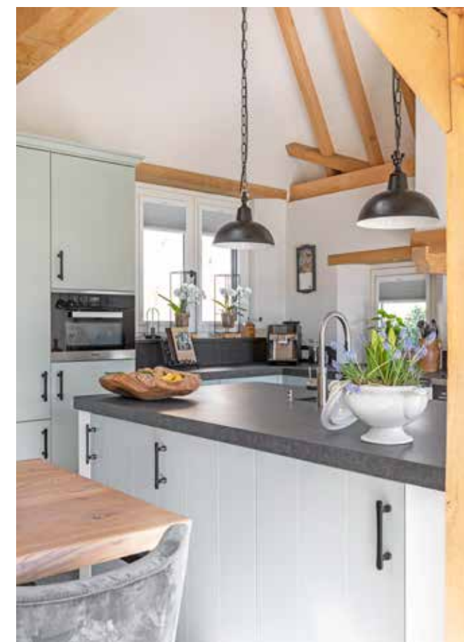
De keuken is van Vosseling Keukens. De keuken is geleverd in de kleur Blue Gray 91 van Farrow & Ball 91. Het aanrechtblad is van composiet. De lampen boven het spoeliland zijn gekocht op stoerelampen.nl.

“We willen ons hier kunnen ontspannen, rust vinden, maar ook gezellig samenzijn”