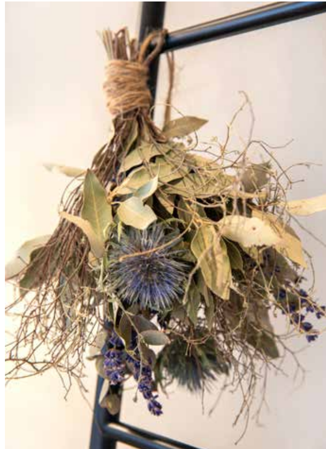
Het zwarte trapje komt van De Bongerd, er hangt een droogboeketje aan van Bloem.