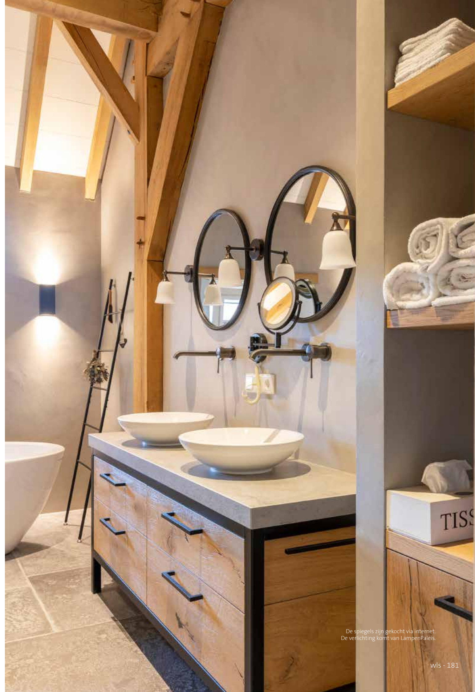
De spiegels zijn gekocht via internet. De verlichting komt van LampenPaleis.

“We droomden er altijd van om landelijk te kunnen wonen”