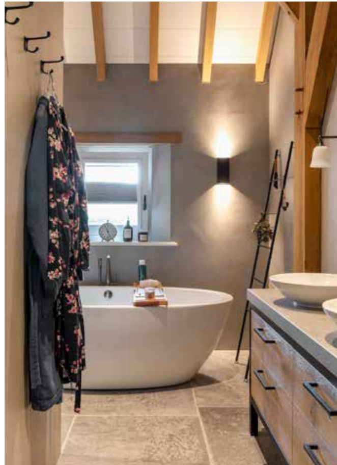
In de badkamer is betonstuc toegepast in de kleur Beton. Al het sanitair voor de badkamer is gekocht bij Middelkoop Culemborg.