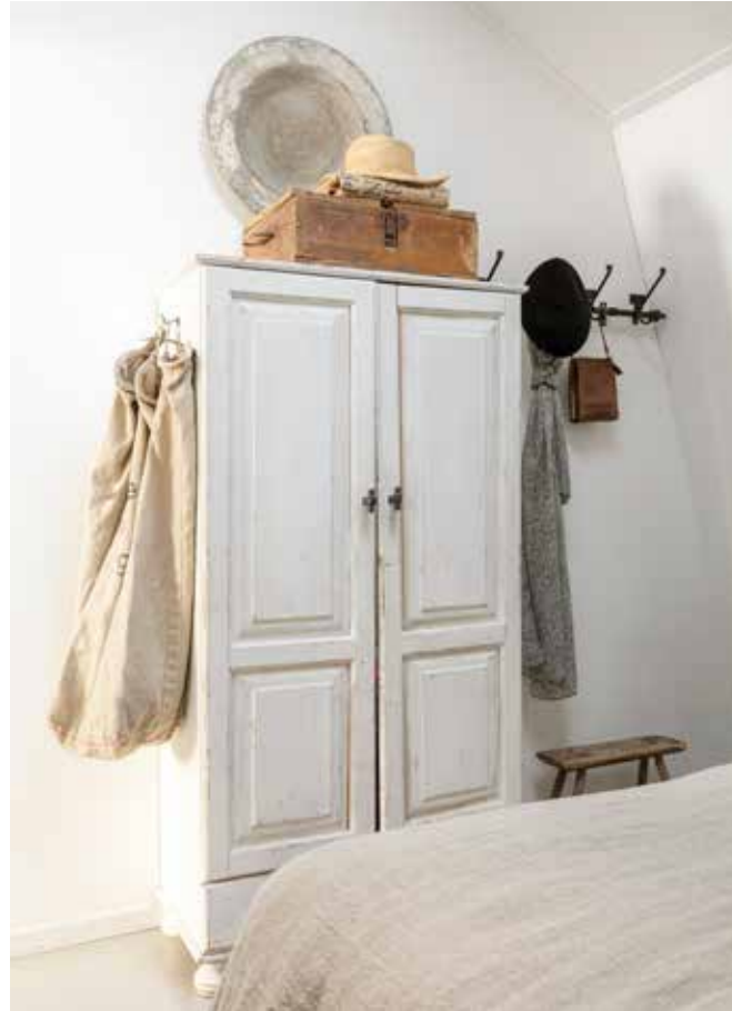
Het kastje vond Renata lang geleden bij een bouwmarkt. Het is wit geverfd en hier en daar doorgeschuurd. Het ronde bord is van Sober & Stoer wonen, de houten kist komt van Woonwinkel De Potstal en de hoed is van van Wonderen Shoes&Stuff. De oude juten koffiezak komt van Intratuin.