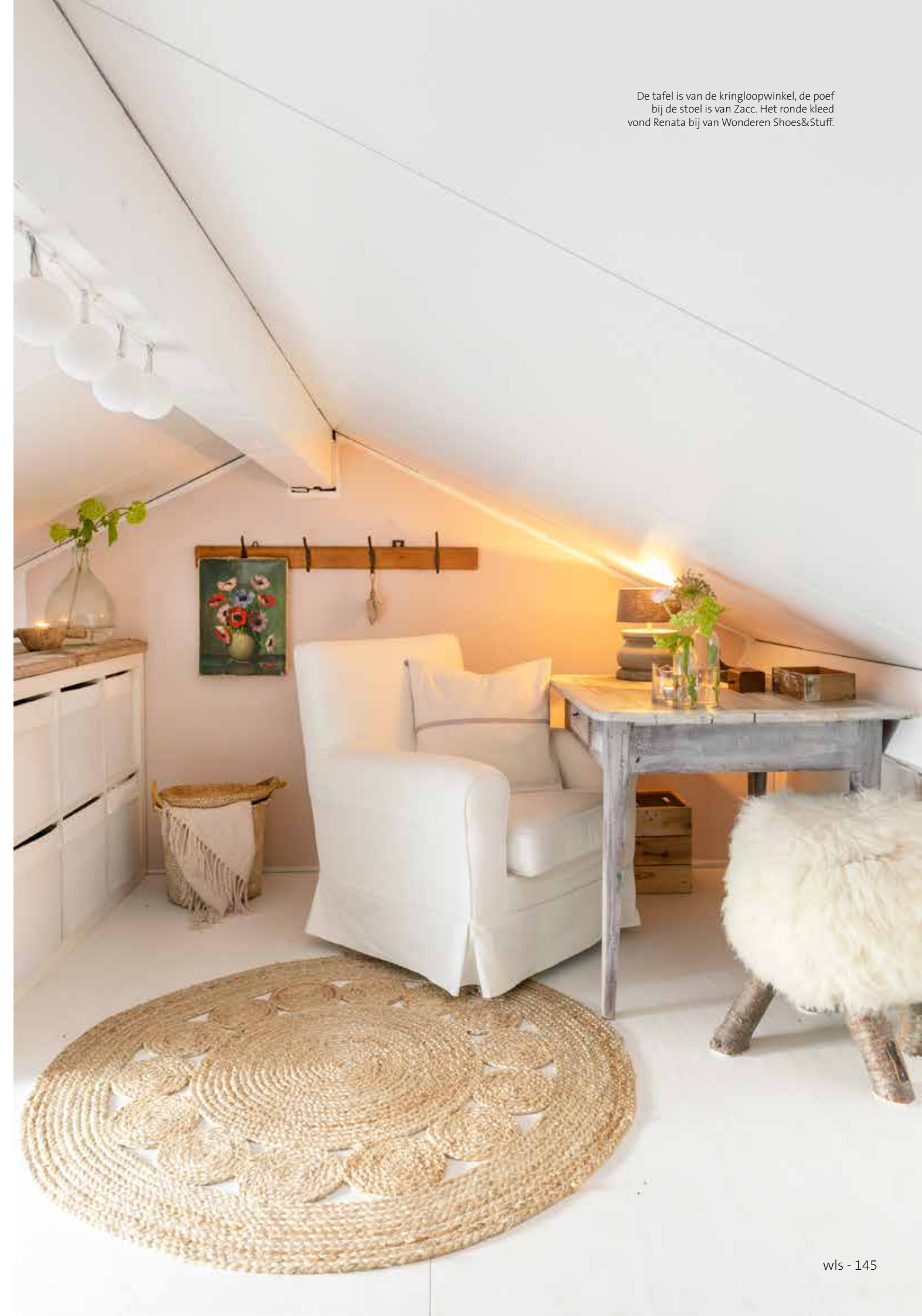
De tafel is van de kringloopwinkel, de poef bij de stoel is van Zacc. Het ronde kleed vond Renata bij van Wonderen Shoes&Stuff.