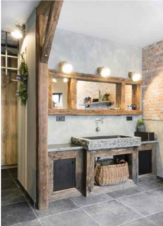
Het badkamermeubel, de hardstenen wasbak en de spiegel van oud hout met staal zijn ontworpen en gemaakt door Patrick Smeets van 't Hooghehuys. Ook alle accessoires komen hiervandaan.