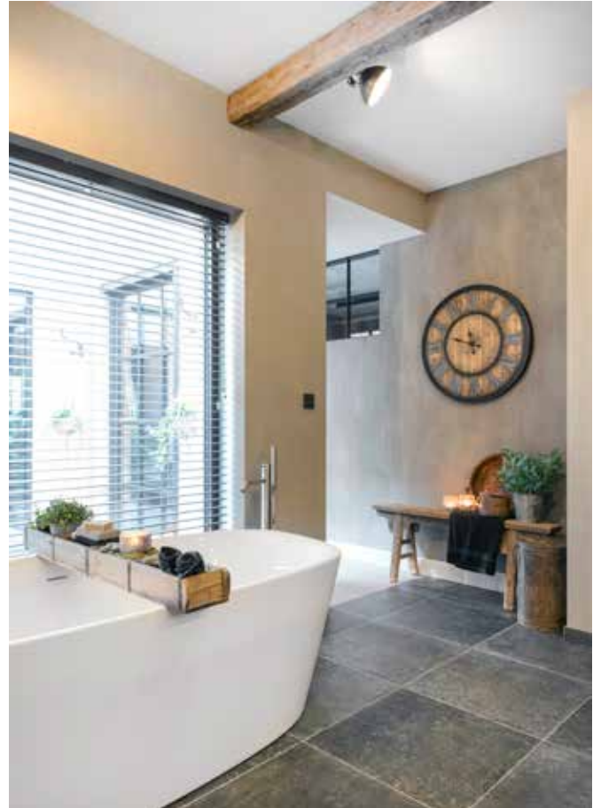
Het bad is van Ideal Standard. De wand is door Carien van Pand 17 bewerkt met een projectverf van Carte Colori die een betonlook geeft, maar die wel afwasbaar en spatwaterdicht is. De gebruikte kleur heet Zinco.

“Alles komt hier samen: het verleden, het heden en onze toekomst”