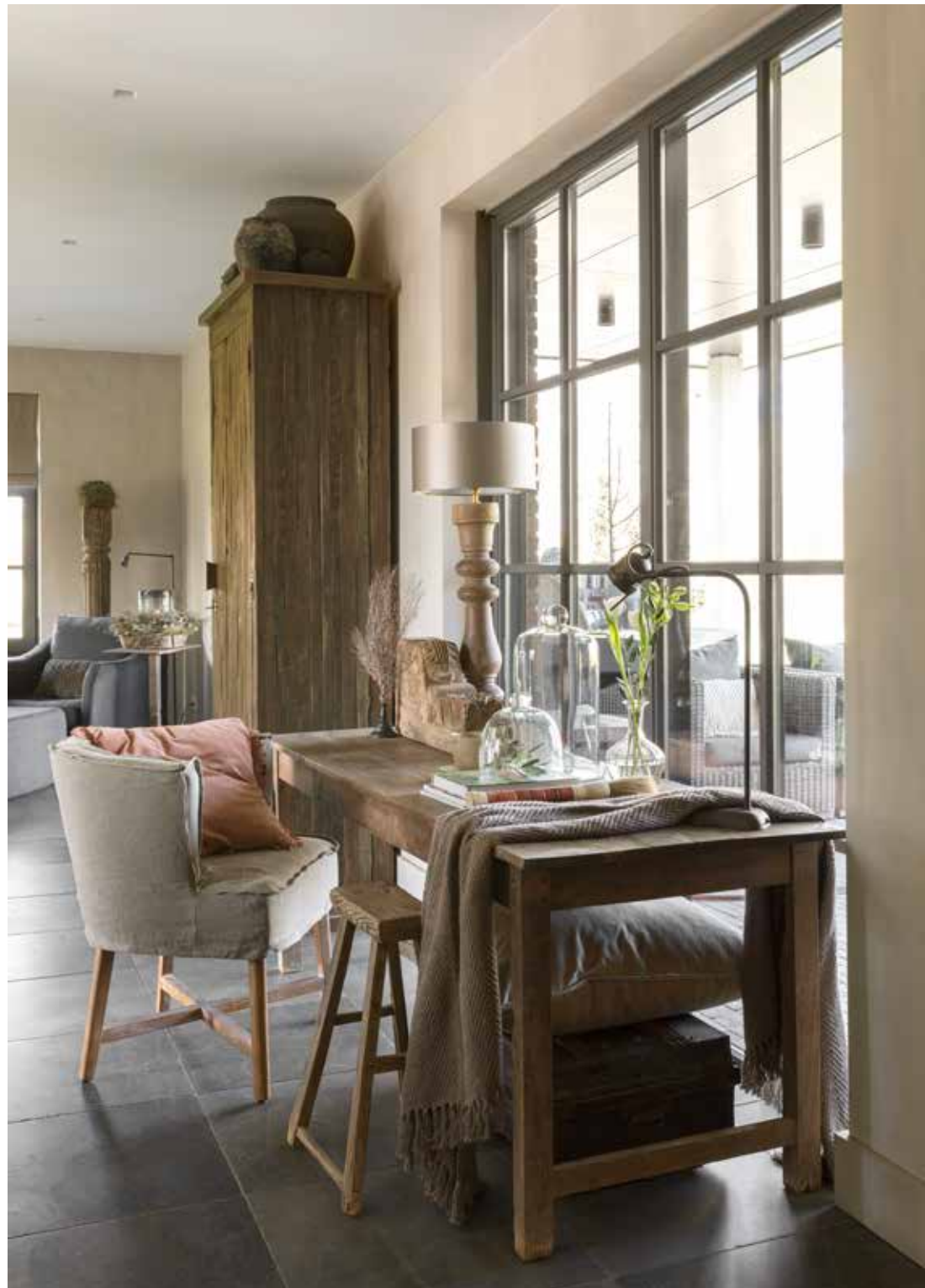
De tafel, stoel Dirkje en de balusterlamp zijn van Aura Peepkorn. Het roze kussen is van MrsBloom en is net als het krukje en de kist onder de tafel verkrijgbaar via Hillary'sHome.