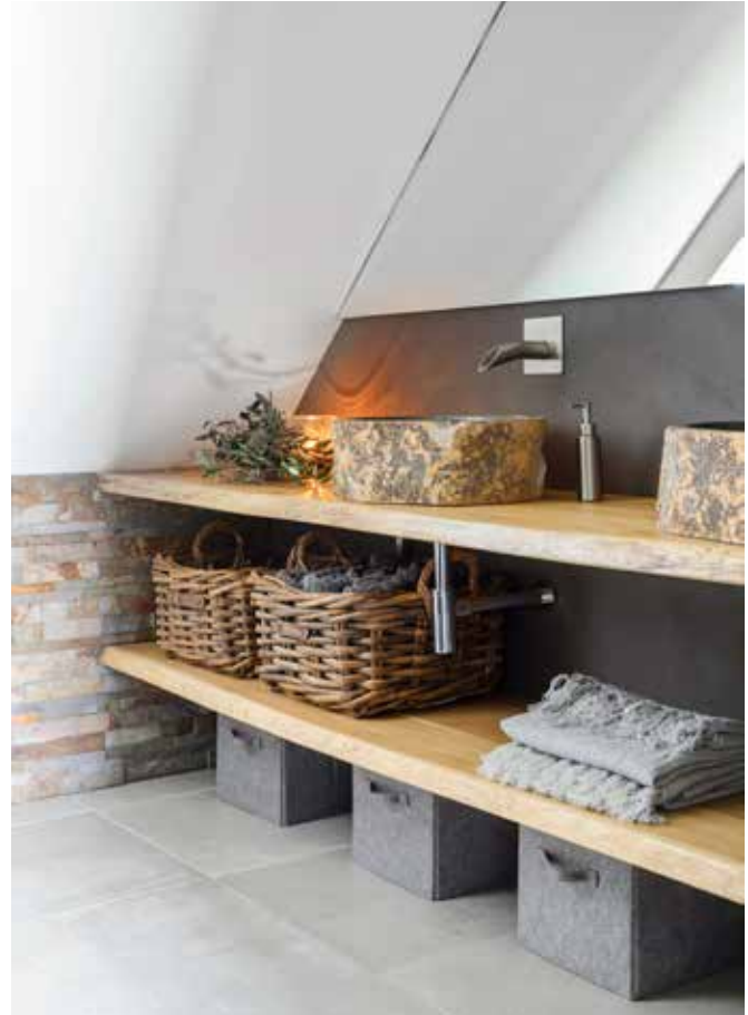
De wasbakken zijn rivierstenen kommen. De rieten manden zijn van Hoffz.

“Ik realiseer me dagelijks wat een hoop moois dit huis ons gezin heeft gebracht”