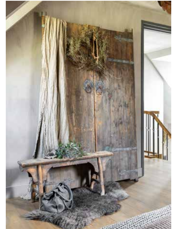
Oude deuren van Aura Peepkorn vormen een mooi geheel tegen de muur. Ze zijn net als het bankje en doek over het paneel te koop op de webshop van Hillary'sHome.

“We hebben een druk bestaan; dan is een huis waar je tot rust komt écht een must”