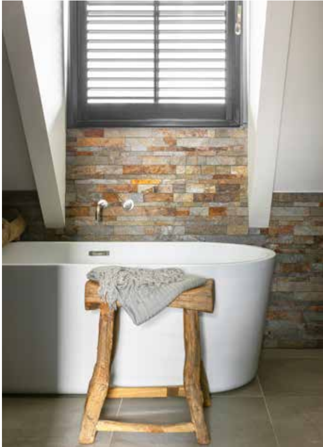
De wand achter het bad is voorzien van steenstrips.