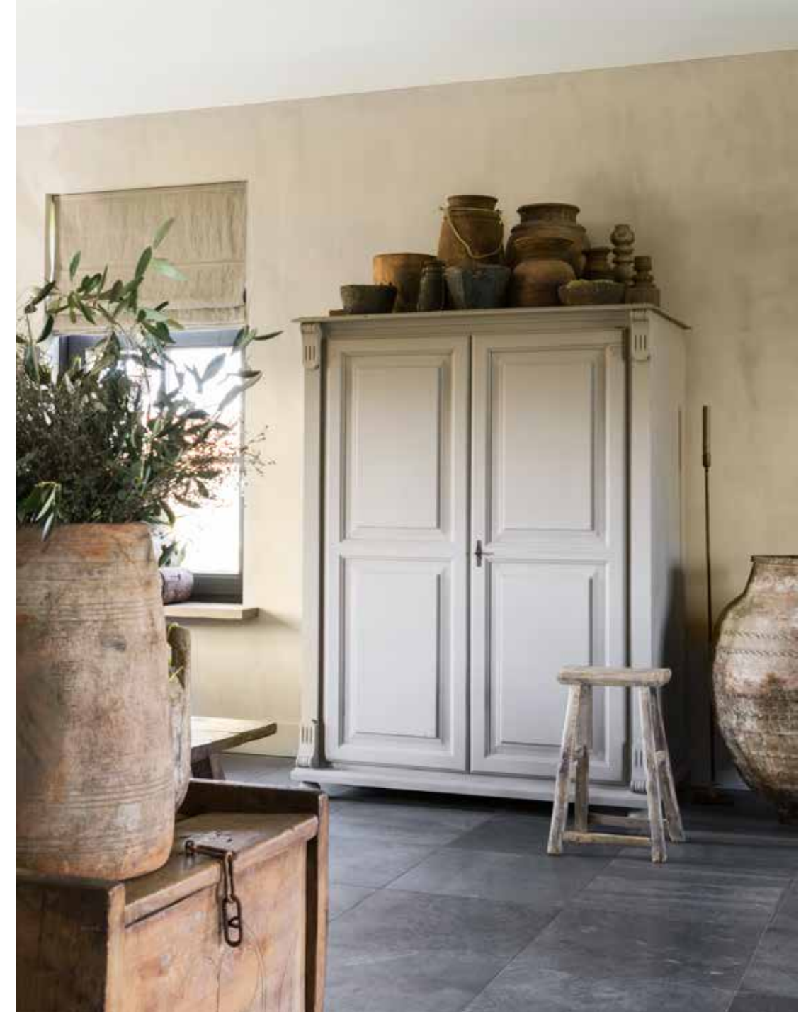
De tv-kast is privébezit. De grote pot en het krukje zijn verkrijgbaar via Hillary'sHome.