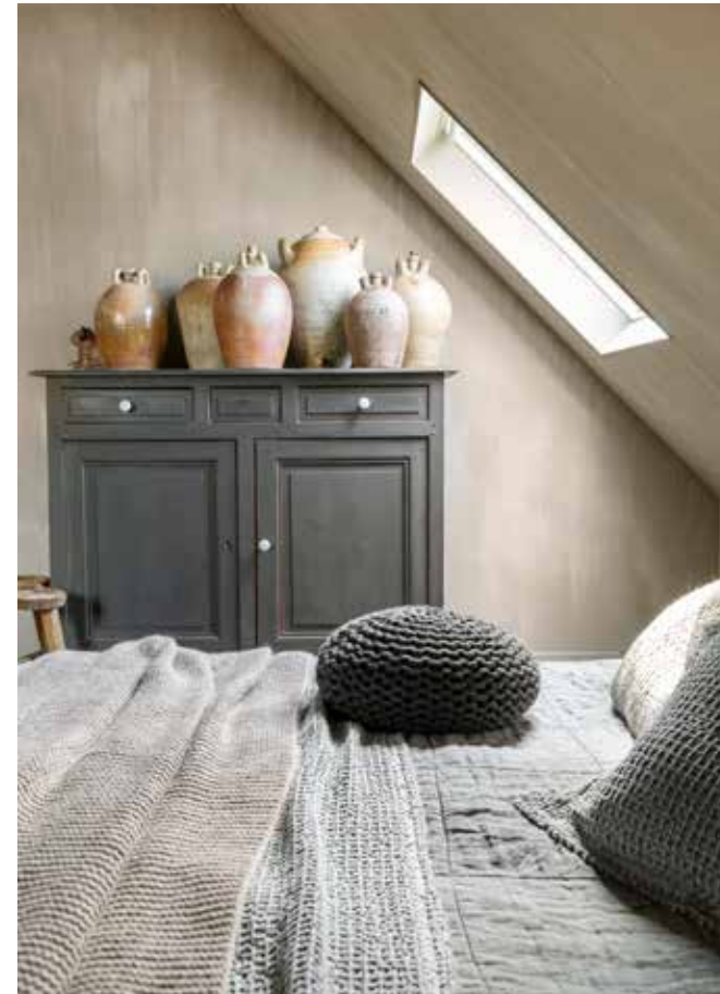
De potten op de kast zijn oude, Franse oliekruiken.