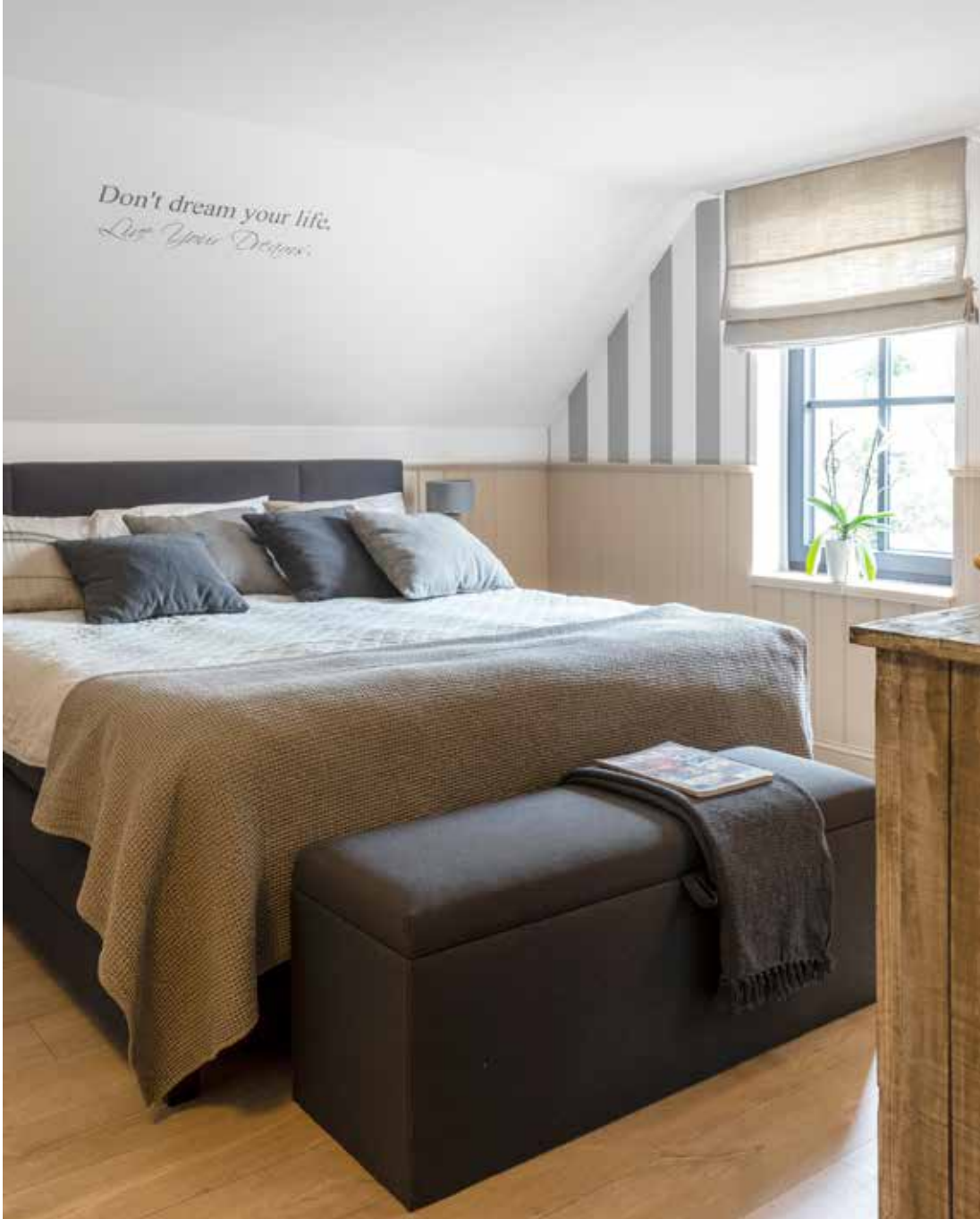
Het bed is van Veldeman Bedding, het beddengoed komt van De Witte Lietaer. De spreij is van Hoffz.

“Ik hoop stiekem dat mijn moeke vanaf een wolk mee zit te genieten”