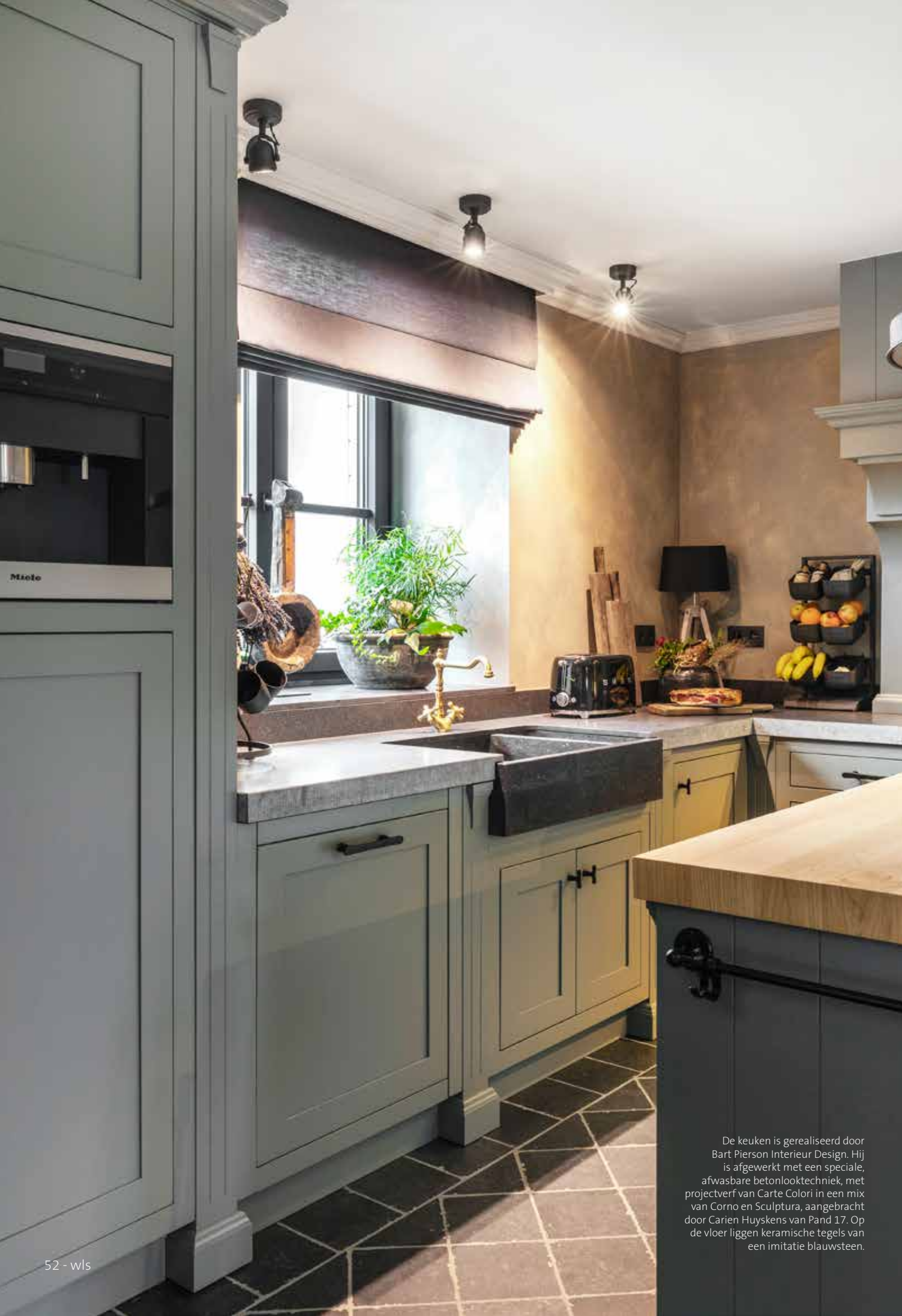
De keuken is gerealiseerd door Bart Pierson Interieur Design. Hij is afgewerkt met een speciale, afwasbare betonlooktechniek, met projectverf van Carte Colori in een mix van Corno en Sculptura, aangebracht door Carien Huyskens van Pand 17. Op de vloer liggen keramische tegels van een imitatie blauwsteen.