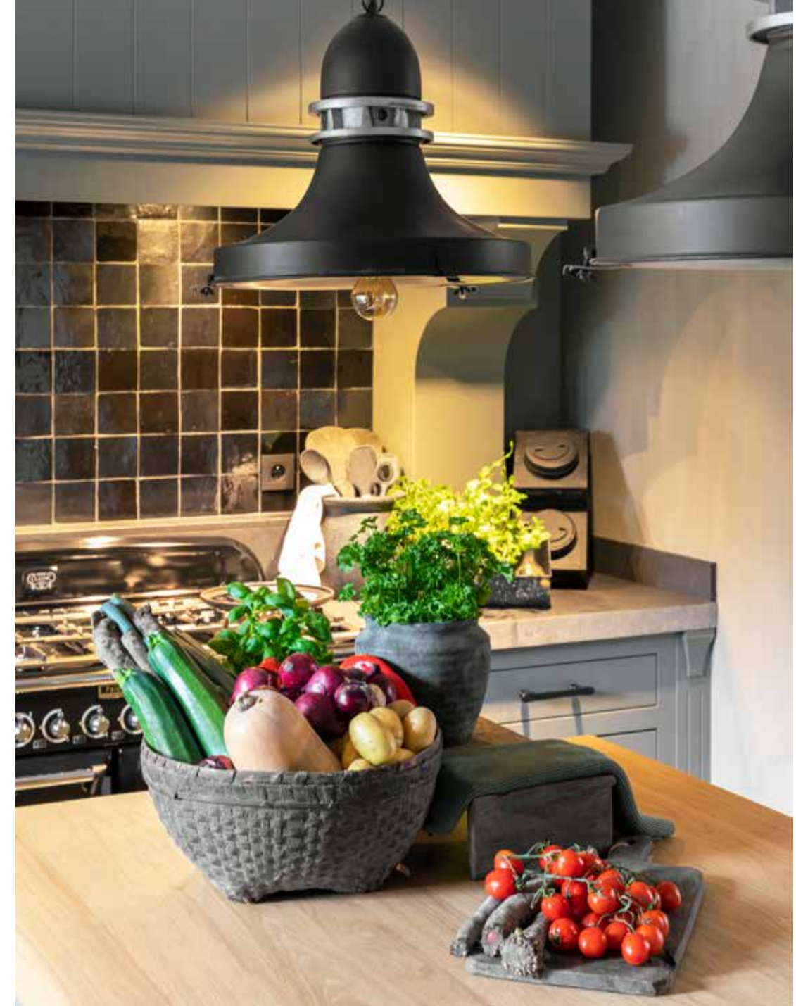
De zwarte tegeltjes achter het fornuis zijn van Seegers Tegeldesign. De lampen boven het eiland komen via 't Hoogehuis.