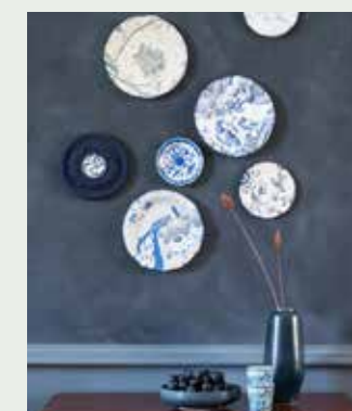
Behang op bordjes: linksboven: Pillar Point-Floral Dew (120 euro per rol), rechtsboven: Fern Toile-Drawing Room (108 euro per rol), rechtsonder en links op ornament: Ashfield Floral-Sapphire (136 euro per rol, alles designersguild.com via wva.nl), floraal behang met pauw en vogels Royal Delft-collectie (prijzen op aanvraag, nicollemayer.com via wva.nl), handgemaakte schaal van keramiek (35 euro, shop.marjokedeheer.com), bekertjes van Chinees porselein (11,95 euro per stuk, sjakies.com), kalkverf Oxford Navy op ornament (7,50 euro per 120 ml, annie-sloan.nl via cininwonen.nl), klaptafel (89 euro), oud Delfts blauw bordje (9,50 euro), blauwe vaas (9,50 euro, alles cininwonen.nl), verf op muur: kalkverf kleur Ink (vanaf 48 euro per liter), verf op lambrisering: krijtlak kleur Ink (vanaf 45,80 euro per 0,75 liter), primer op kleur (prijzen op aanvraag, alles cartecolori.nl)