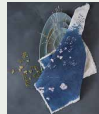
Handgemaakt keramiek: schalen organic shape (vanaf 23 tot 75 euro per stuk, shop.marjokedeheer.com), linnen servet (9,95 euro per stuk, sjakies.com), verf ondergrond: kalkverf kleur Ink (vanaf 48 euro per liter, cartecolori.nl)