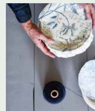
Behang op groot bordje: Pillar Point-Floral Dew (120 euro per rol), behang op klein bordje: Cerato-Porcelain (78 euro per rol, beide designersguild.com via wva.nl), papieren bordjes