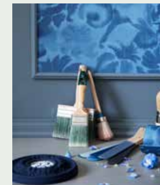
Kalkverf Oxford Navy op ornament (7,50 euro per 120 ml, annie-sloan.nl via cininwonen.nl), diverse kwasten en kleurstalen (prijzen op aanvraag, cartecolori.nl en cininwonen.nl), mdf, profiellatten, foam sierlijsten, ornament (Decoflair via diverse bouwmarkten)