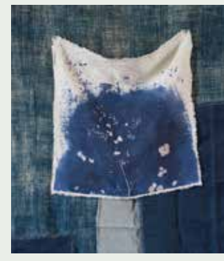
Linnen servetten in diverse kleuren, onbedrukt (9,95 euro per stuk), plaid van vintage denim (129,95 euro, alles sjakies.com)