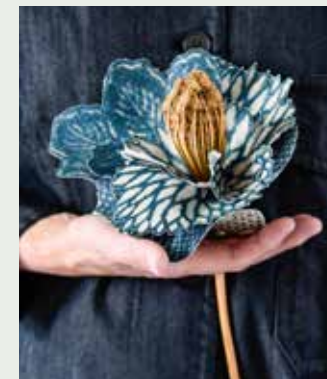
Bloem van stoffen Sakai Floral-Indigo met blaadjes van Kotori Floral-Overdyed Indigo uit de collectie Signature Artisan Loft Fabrics van Ralph Lauren (prijzen op aanvraag, designersguild.com via wva.nl), verf op muur: kalkverf kleur Ink (vanaf 48 euro per liter), primer op kleur (prijzen op aanvraag, beide cartecolori.nl), stoel (79 euro), klaptafeltje (89 euro, beide cininwonen.nl), blauwe aardewerken pot (79,95 euro, loberon.nl)

Knip diverse formaten 'bordjes' uit verschillende behangsoorten die mooi bij elkaar combineren en gebruik hiervoor steeds een ander omgekeerd bordje als mal. Smeer vervolgens de bovenkant van de bordjes met een kwastje in met kant-en-klare behanglijm en lijm hierop steeds een uitgeknipte cirkel van behangpapier. Druk het papier goed aan zodat de vorm van elk bordje zichtbaar wordt. Vouw vervolgens de papierranden strak om de rand van het bordje. Laat de lijm nu goed opdrogen. Als alles helemaal droog is, kun je voor een extra ambachtelijk gevoel de rand van elk bordje voorzichtig doorstikken met blauw garen op de naaimachine. Gebruik voor het karton de grootste steek van je machine. Ben je hiermee niet zo handig, dan kun je de randen ook vastlijmen aan de onderkant van het kartonnen bord. Als alles droog is, maak je met de bordjes een mooie combinatie op de wand. Bevestigen kan gemakkelijk met kneedlijm. Voor een extra verrassingseffect is het leuk om hier en daar een echt Delfts blauw bordje of ornament toe te voegen.