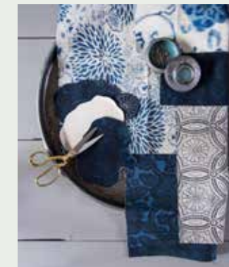
Stofstalen uit de collectie Signature Artisan Loft Fabrics van Ralph Lauren: Kaizu Floral-Aged Porcelain, Kotori Floral-Porcelain, Kotori Floral-Overdyed Indigo, Mingei Batik-Indigo, Augustine Floral-Indigo, Kotori Floral-Overdyed Indigo (prijzen op aanvraag, designersguild.com via wva.nl), handgemaakt keramiek dekseldoosje (85 euro, shop.marjokedeheer.com), ijzeren dienblad (29 euro, cininwonen.nl)