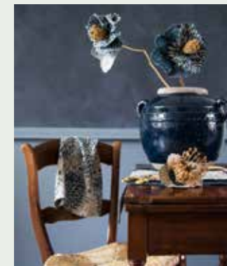
Bloemen van diverse stoffen uit de collectie Signature Artisan Loft Fabrics van Ralph Lauren (prijzen op aanvraag, designersguild.com via wva.nl), verf op muur: kalkverf kleur Ink (vanaf 48 euro per liter), primer op kleur (prijzen op aanvraag, beide cartecolori.nl), stoel (79 euro), klaptafeltje (89 euro, beide cininwonen.nl), blauwe aardewerken pot (79,95 euro, loberon.nl)