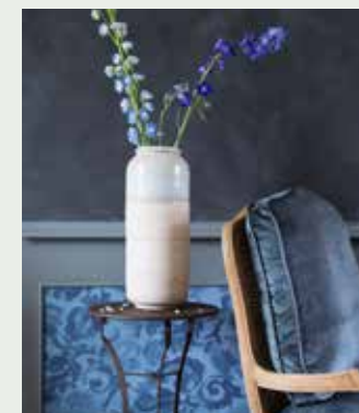
Verf op muur: kalkverf kleur Ink (vanaf 48 euro per liter), verf op lambrisering: krijtlak kleur Ink (vanaf 45,80 euro per 0,75 liter), primer op kleur (prijzen op aanvraag, alles cartecolori.nl), fauteuil Corlay (698 euro), bijzettafel Torrance (78,95 euro, beide loberon.nl), behang Katagami Indigo (118 euro per rol van 70 cm breed, designersguild.com via wva.nl), handgemaakte vaas van keramiek (150 euro, shop.marjokedeheer.com)