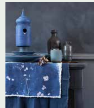
Handgemaakt keramiek: vogelhuisje (100 euro), XXL waterschaal (175 euro), batikbord blue (50 euro), kleine schaal (35 euro) donkere flesvaas (85 euro), kruikje (38 euro), little pot of memory (150 euro, alles shop.marjokedeheer.com), linnen servetten, onbedrukt (9,95 euro per stuk, sjakies.com), kastje (235 euro, cininwonen.nl), geschilderd met krijtverf Negro Intenso (prijzen op aanvraag, creatieve.be), verf op muur: kalkverf kleur Ink (vanaf 48 euro per liter), verf op lambrisering: krijtlak kleur Ink (vanaf 45,80 euro per 0,75 liter), primer op kleur (prijzen op aanvraag, alles cartecolori.nl)