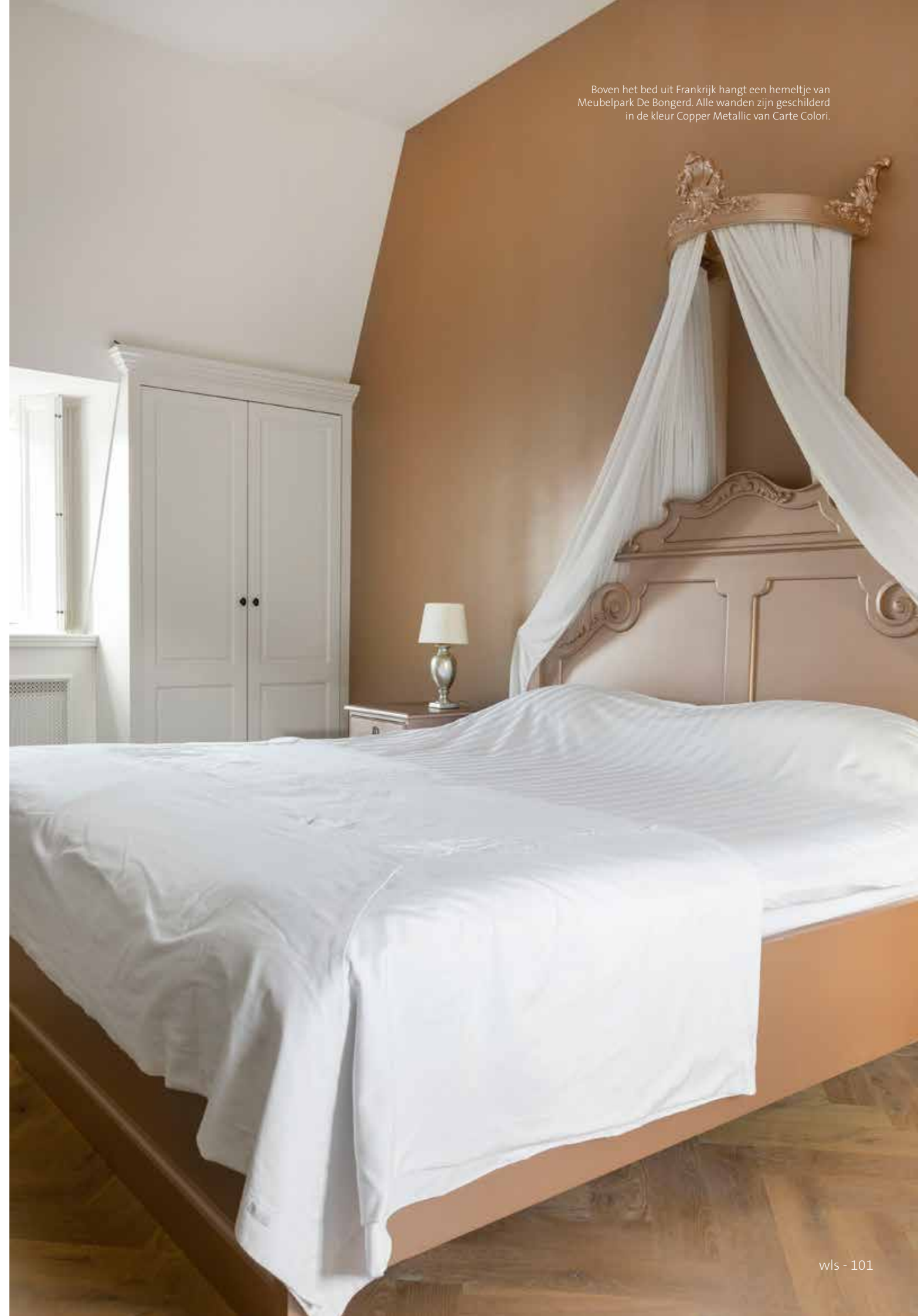
Boven het bed uit Frankrijk hangt een hemeltje van Meubelpark De Bongerd. Alle wanden zijn geschilderd in de kleur Copper Metallic van Carte Colori.