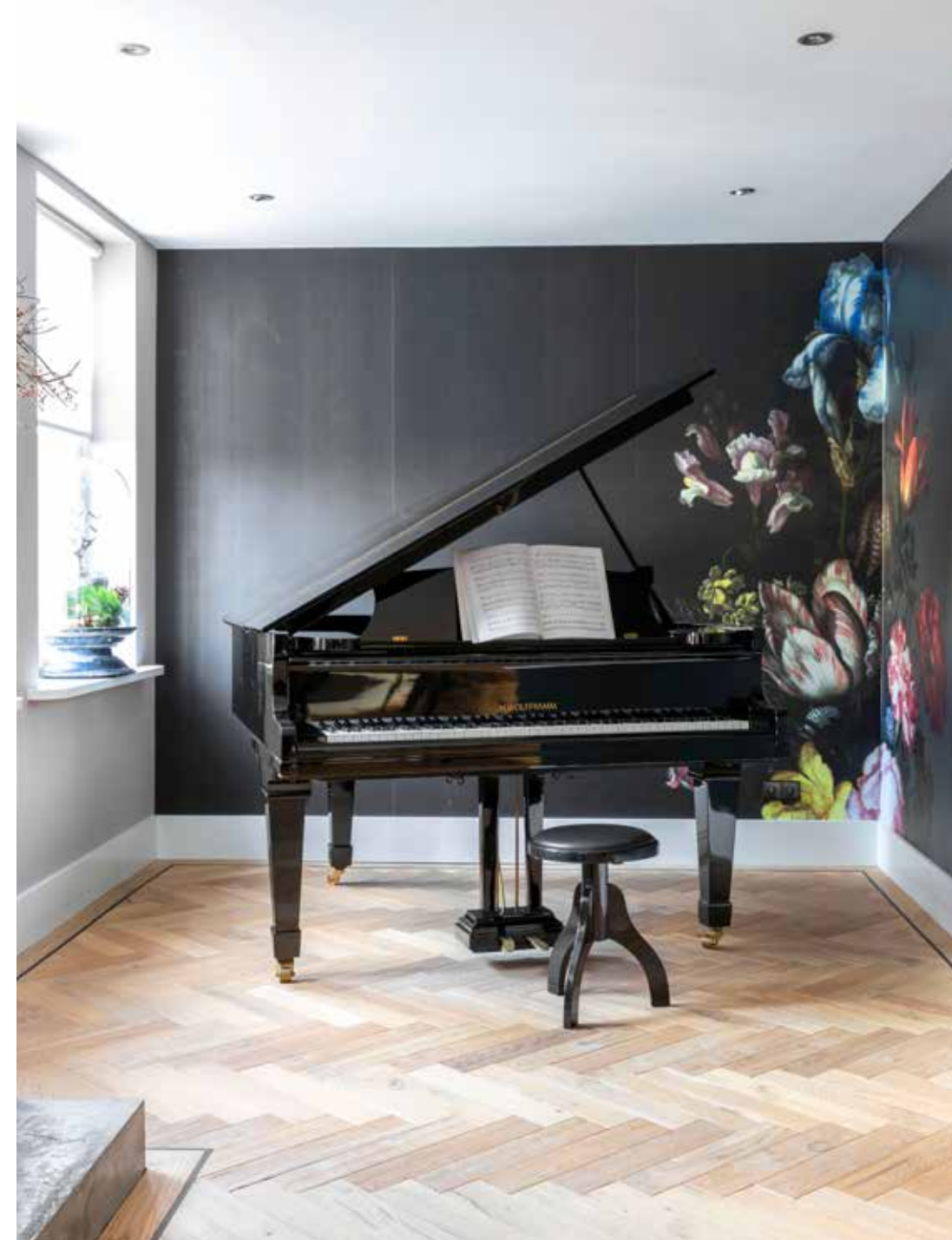
In een hoek van de woonkamer trekt een vleugel de aandacht. Het behang werd op maat besteld bij ColoRay.