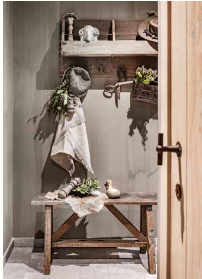
De grijze kalkverf van Carte Colori camoufleert het nieuwe van de woning. Door overal op de begane grond dezelfde kleur toe te passen, vloeien de ruimtes harmonieus in elkaar over.