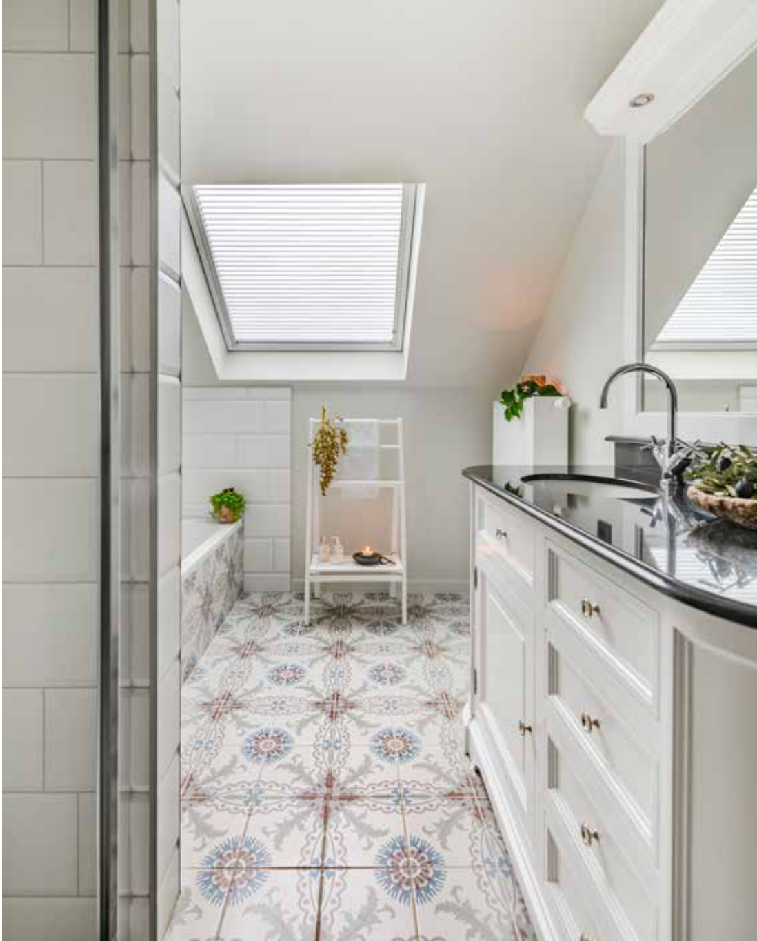
Het badkamermeubel werd uitgekozen via Bo & Dou Interieur. De wastafel is van natuursteen. De keramische vloertegels (20x20 cm) zijn van Revoir Paris.

“We zijn blij met ons nieuwbouwhuis dat amper onderhoud vraagt”