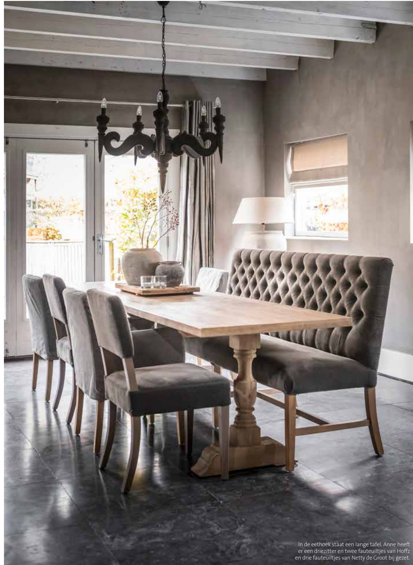
In de eethoek staat een lange tafel. Anne heeft er een driezitter en twee fauteuilltjes van Hoffz en drie fauteuilltjes van Netty de Groot bij gezet.

“Ik heb veel zelf bedacht en ook veel zelf gedaan”