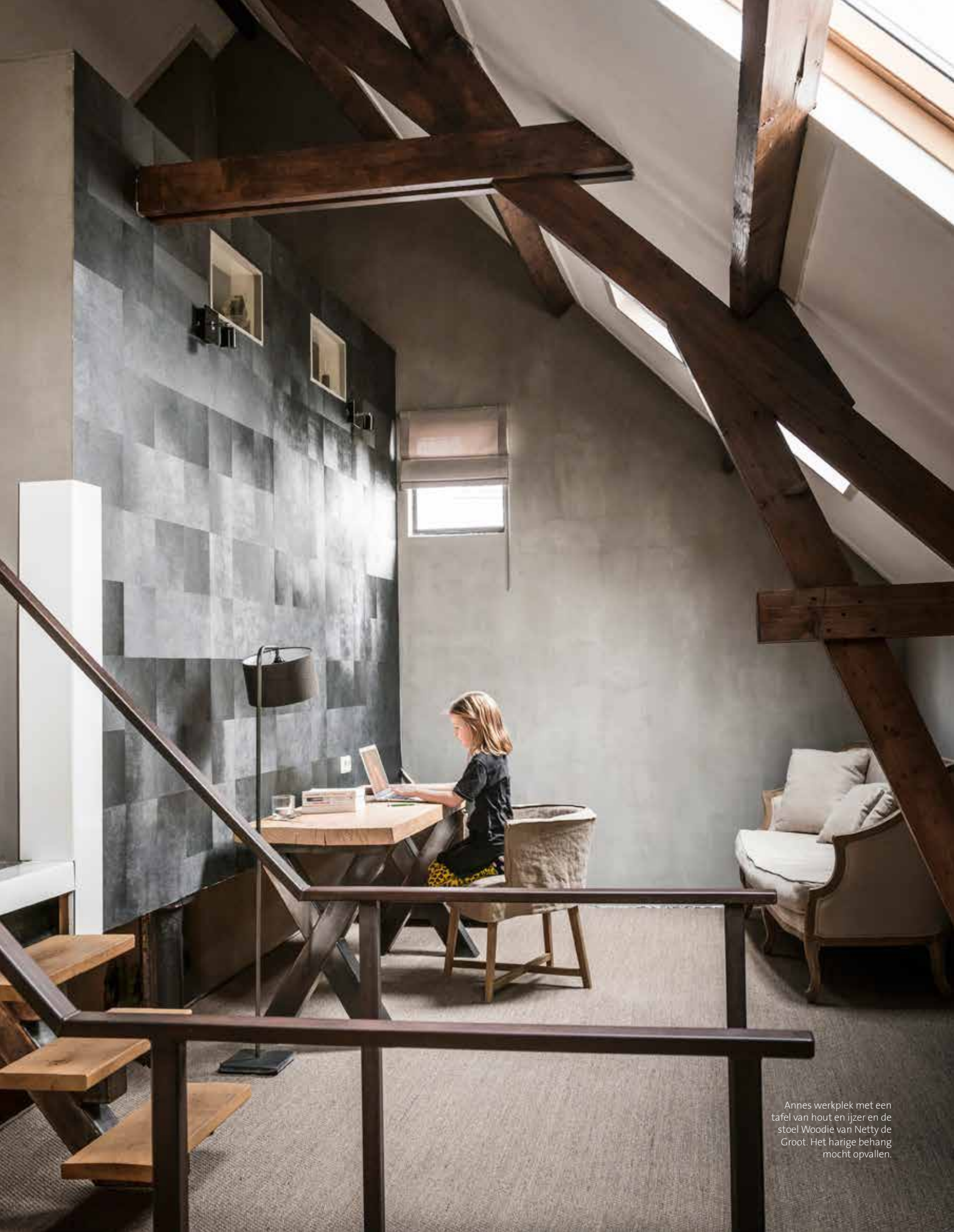
Annes werkplek met een tafel van hout en ijzer en de stoel Woodie van Netty de Groot. Het harige behang mocht opvallen.