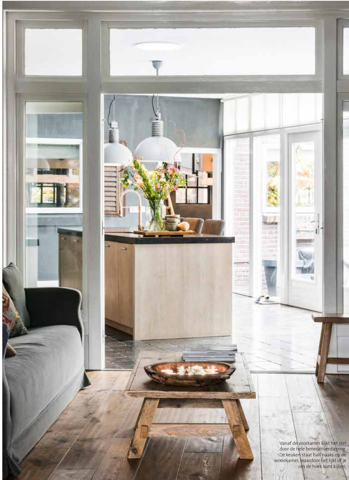
Vanaf de voorkamer kijkt het stel door de hele benedenverdieping. De keuken staat half haaks op de woonkamer, waardoor het lijkt of je om de hoek kunt kijken.