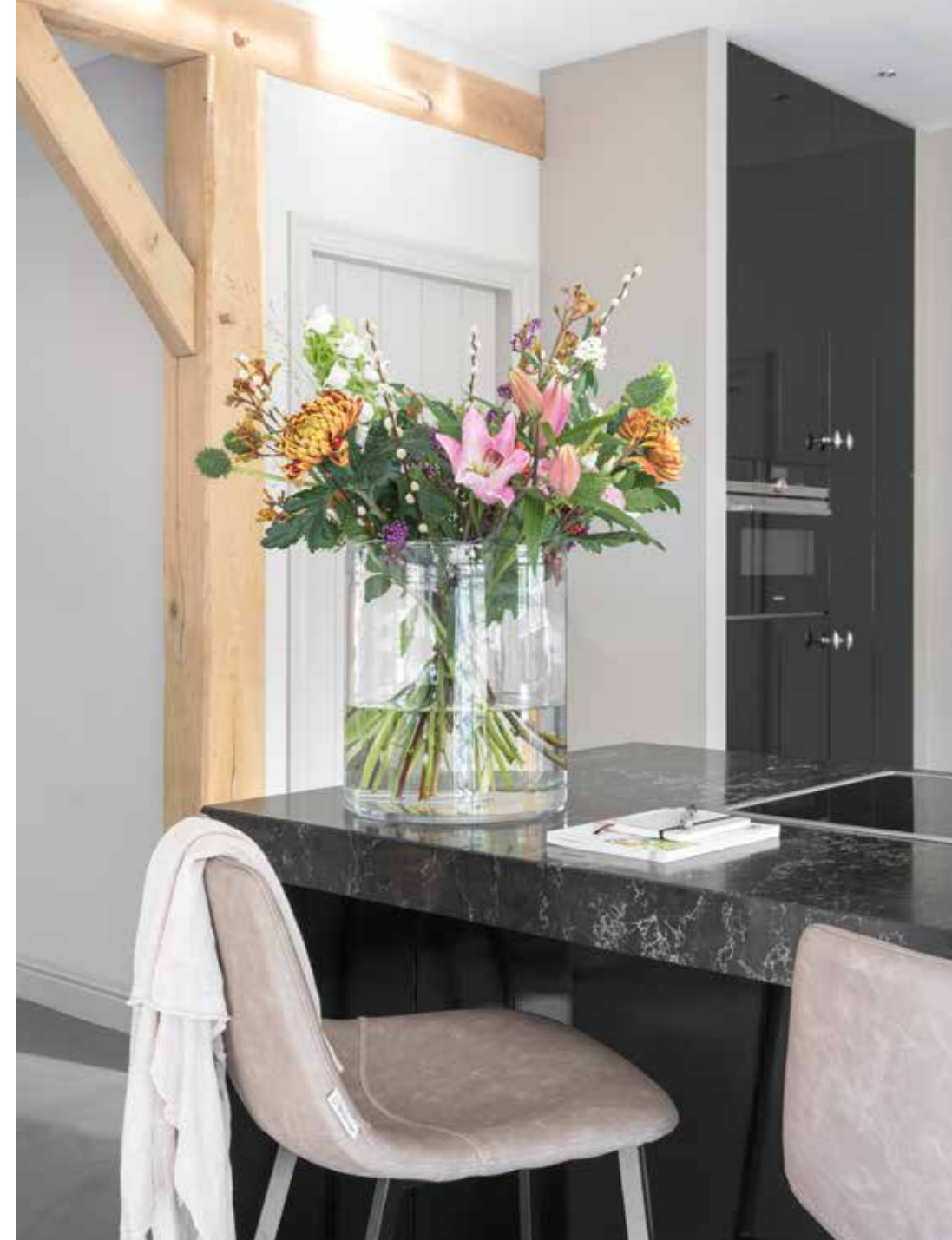
De keuken is gerealiseerd door By Sensa Keukens. De stalen barkrukken met lederen zitting zijn van RV Design.