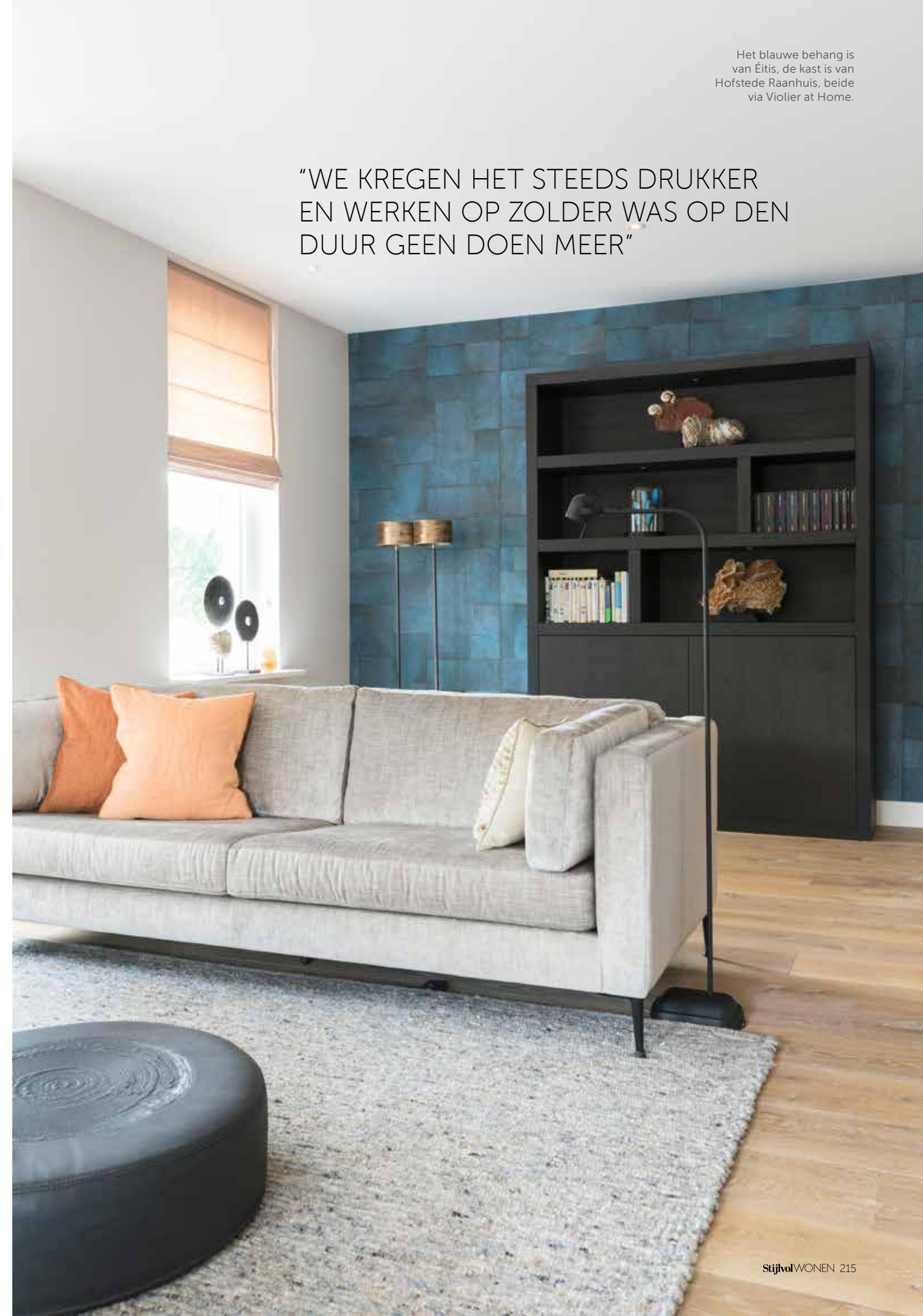
Het blauwe behang is van Étis, de kast is van Hofstede Raanhuis, beide via Violier at Home.

De woonkamer is zo ontworpen dat het hele gezin hier, met drie kinderen, kan verblijven. Wulf heeft hiervoor sterke stoffen geadviseerd en er een speels en spannend geheel van gemaakt.