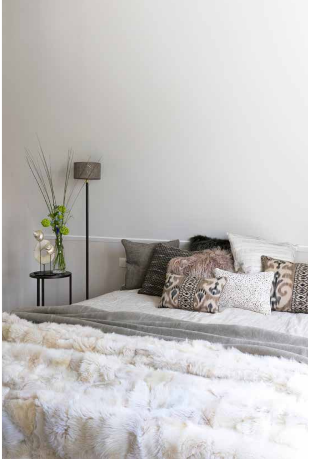
Het bed namen de bewoners mee uit hun vorige huis. Het bedtextiel, de kussens en de bedtafeltjes zijn van Violier at Home. Lampjes Frezoli en Duran Lighting & Interiors via Violier at Home. De bloemen zijn van De Violier in Veenendaal.