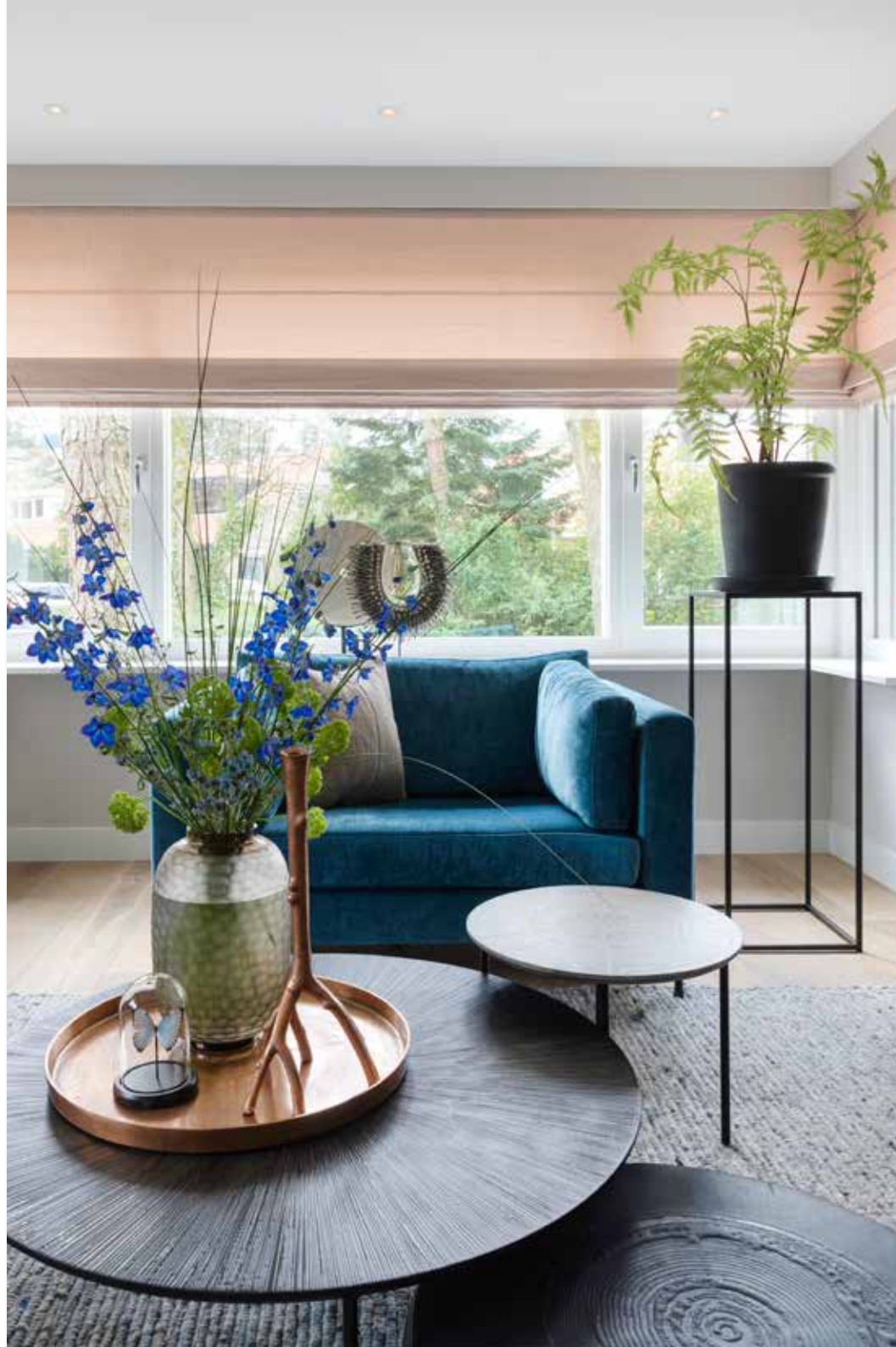
De ronde tafels zijn van Violier at Home, evenals de accessoires.