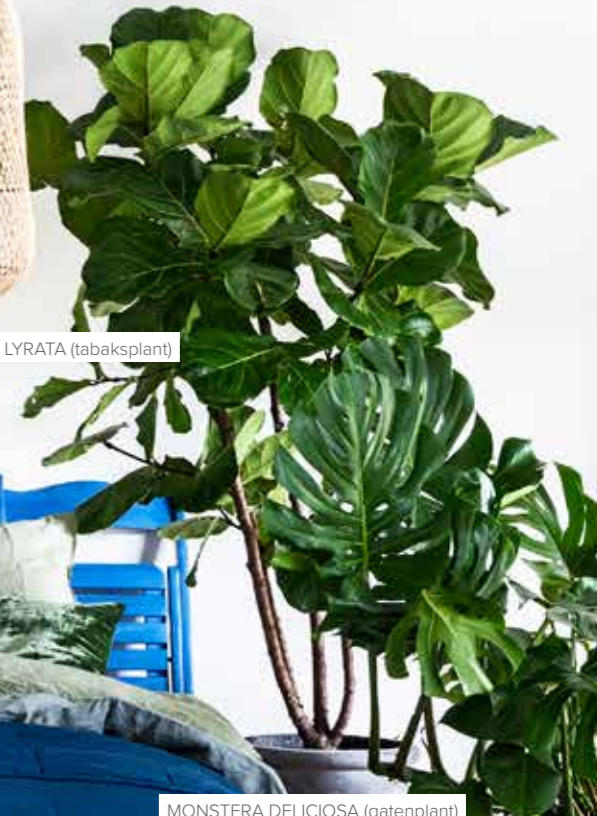
MONSTERA DELICIOSA (gatenplant)