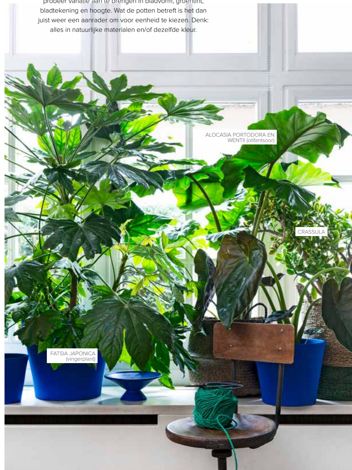
ALOCASIA PORTODORA EN WENTII (olifantsoor)

Eén plantenverzameling maakt meer indruk dan her en der door de ruimte verspreide exemplaren. De cluster-truc: probeer variatie aan te brengen in bladvorm, groentint, bladtekening en hoogte. Wat de potten betreft is het dan juist weer een aanrader om voor eenheid te kiezen. Denk: alles in natuurlijke materialen en/of dezelfde kleur.