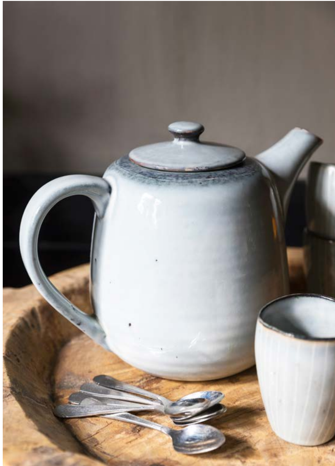
Het servies is van Broste Copenhagen.