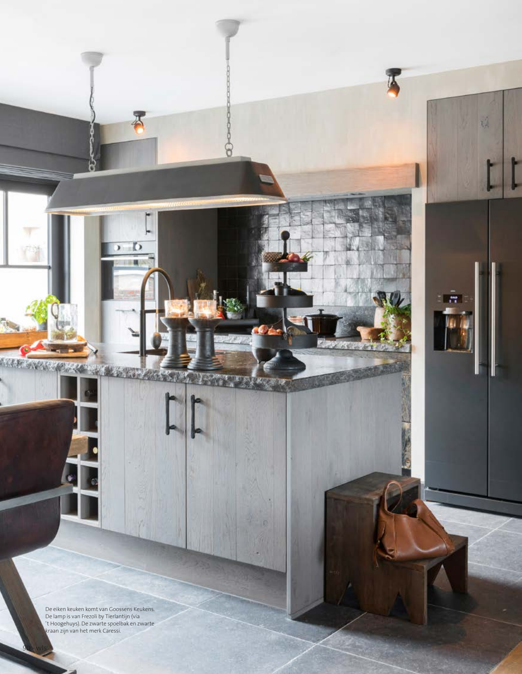
De eiken keuken komt van Goossens Keukens. De lamp is van Frezoli by Tierlantijn (via 't Hoogehuis). De zwarte spoelbak en zwarte kraan zijn van het merk Caressi.