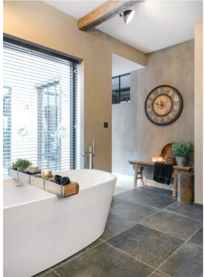
Het bad is van Ideal Standard. De wand is door Carien van Pand 17 bewerkt met een projectverf van Carte Colori die een betonlook geeft, maar die wel afwasbaar en spatwaterdicht is. De gebruikte kleur heet Zinco.

“Alles komt hier samen: het verleden, het heden en onze toekomst”