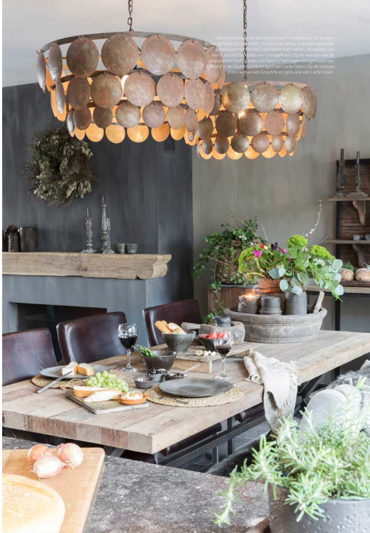
De eiken eettafel en de kast zijn van 't Hoogehuys. De lampen boven de tafel zijn van Hoffz. De bank van Marq is op maat gemaakt en bekleed met een stof van linnen met katoen, de stoelen zijn van staal met leer (alles via 't Hoogehuys). Op de wanden van de woonkamer heeft Garien van Pand 17 een eigen mix gemaakt van kalkverf in de kleuren Gritti en Split van Carte Colori. Op de schouw zitten kalkverven Graphite en Split, ook van Carte Colori.