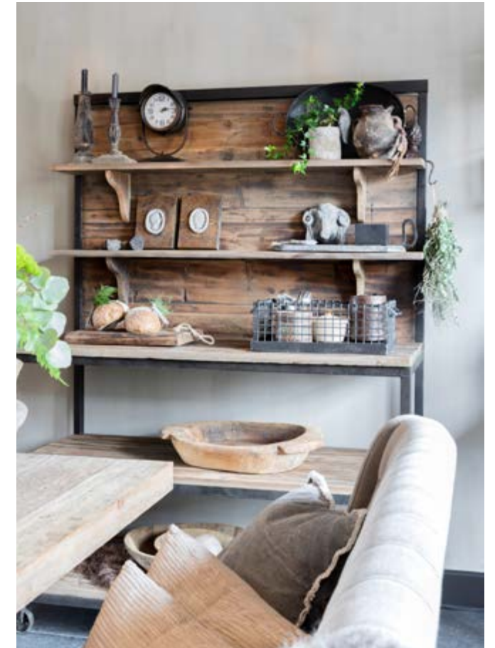
Op de wanden van de eetkamer is kalkverf Lino/Sculptura mix gebruikt van Carte Colori.

“Onze woning is splinternieuw, maar lijkt en voelt geleefd en oud”