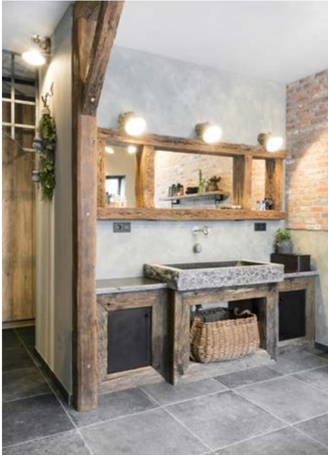
Het badkamermeubel, de hardstenen wasbak en de spiegel van oud hout met staal zijn ontworpen en gemaakt door Patrick Smeets van 't Hoogehuys. Ook alle accessoires komen hiervandaan.