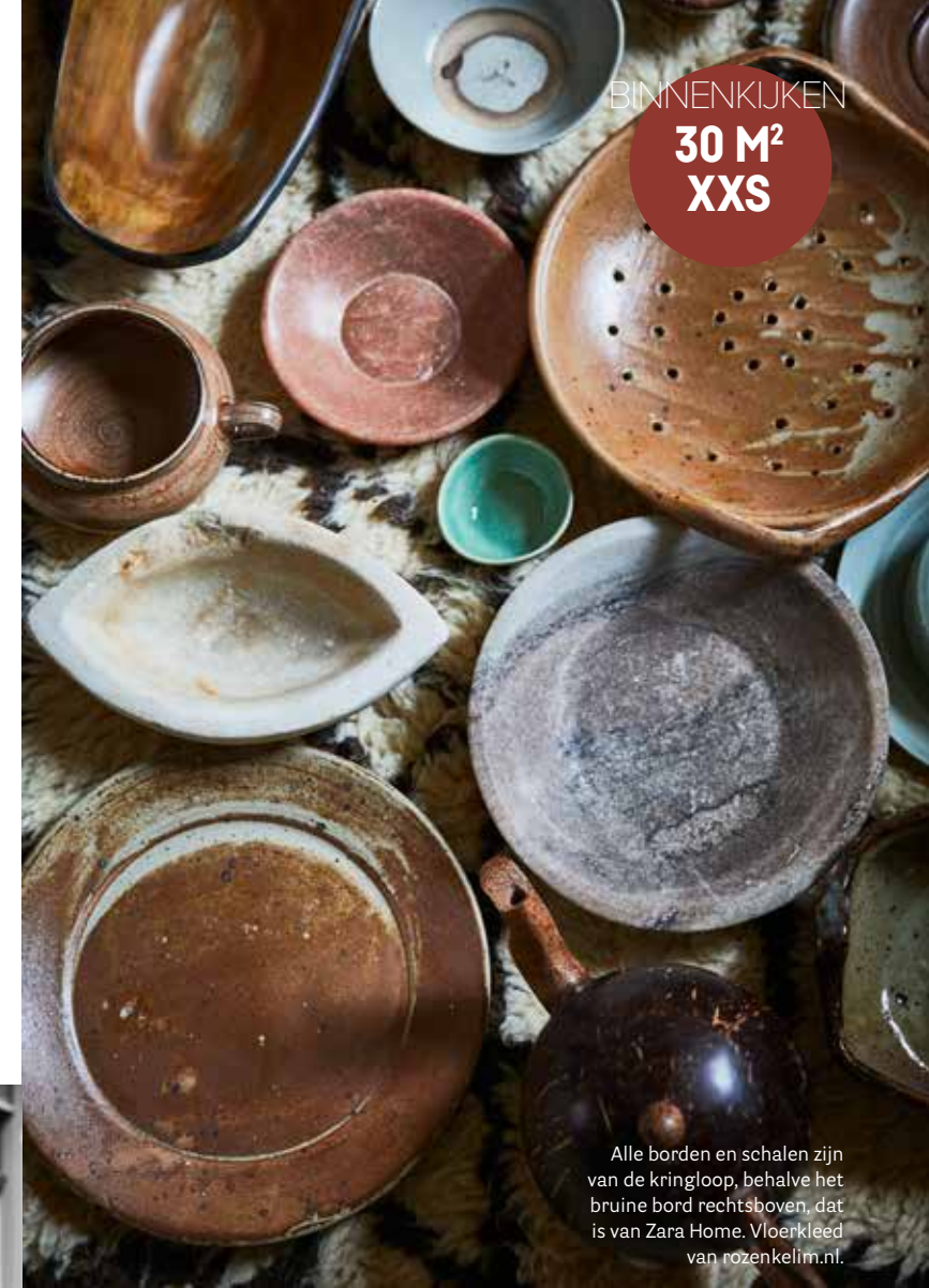
Alle borden en schalen zijn van de kringloop, behalve het bruine bord rechtsboven, dat is van Zara Home. Vloerkleed van rozenkelim.nl.