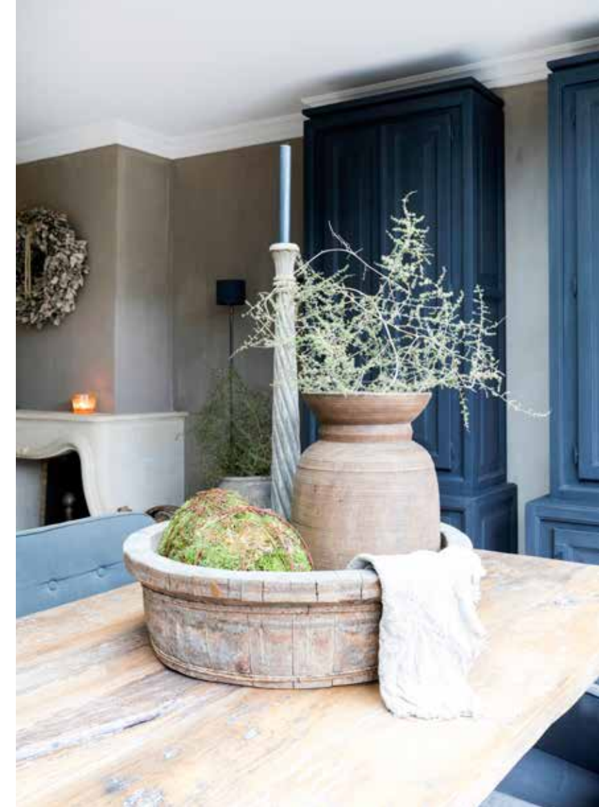
De eiken eettafel is op maat gemaakt door Restyle XL. De bak op tafel is van Rust & tiek. De draadballen zijn van Hoffz (via Deco Enzo). Tegen de wand staan twee kasten van Keijser & Co (via Sober & Sjiem)