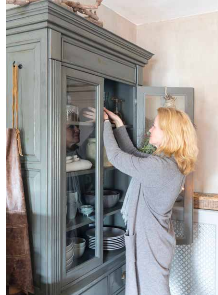
De servieskast, een grenen exemplaar gekocht bij Sil's Home in Donkerbroek, heeft een mooie, natuurlijke grijstint.

“Dit voelt echt als thuis en dat komt door het huis, maar zeker ook door het mooie interieur”