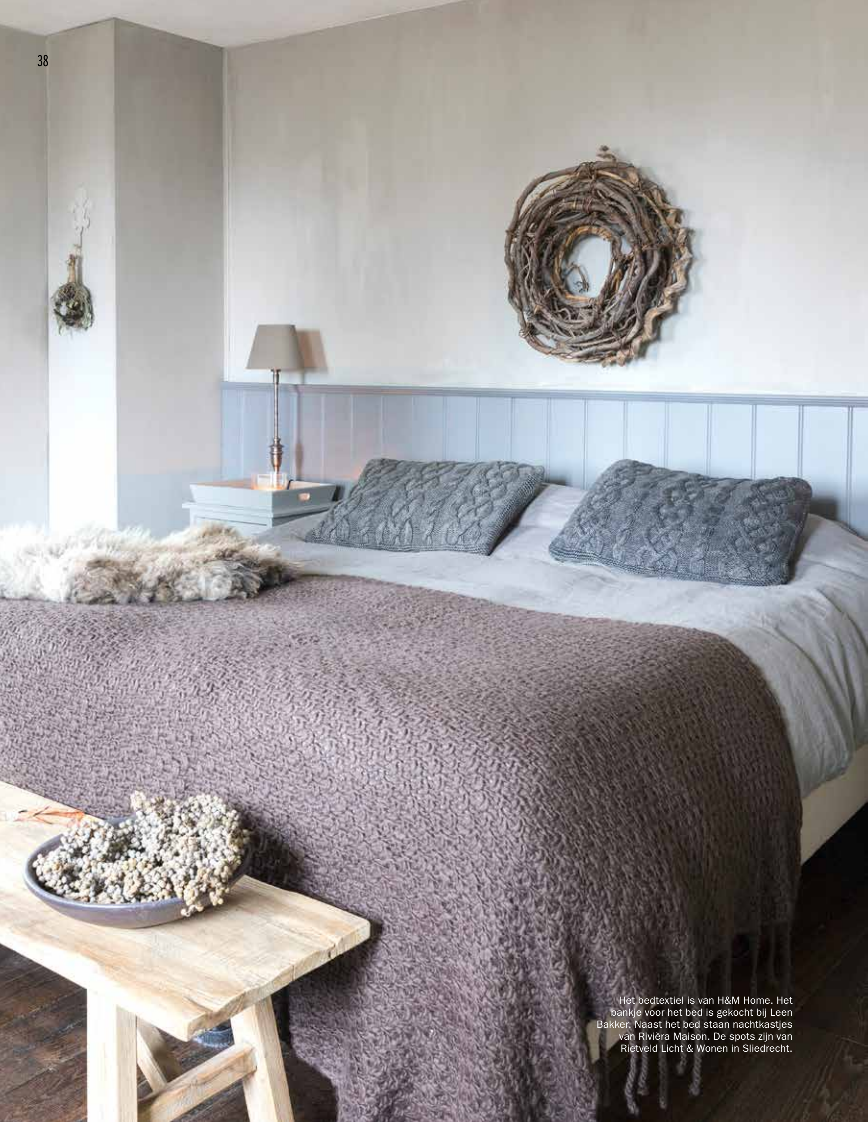
Het bedtextiel is van H&M Home. Het bankje voor het bed is gekocht bij Leen Bakker. Naast het bed staan nachtkastjes van Riviera Maison. De spots zijn van Rietveld Licht & Wonen in Sliedrecht.