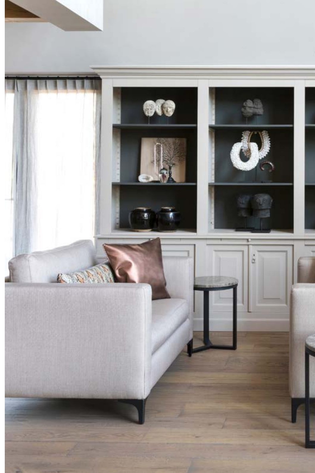
Voor de ramen hangen linnen inbetweens en houten jaloezieën, via Wulf van de Pol. Op de muren in de woonkamer is kalkverf Skin van Carte Colori toegepast (Schilderwerken Bas Bleeker in Veenendaal). Twee fauteuils van Keijser&Co vormen samen een tweede zithoek in de grote woonkamer. In de wandkast staan bijzondere accessoires van onder andere MD (alles Violier at Home).

“DE LOCATIE IS FANTASTISCH: ACHTERAAN UITZICHT OP WEILANDEN, AAN DE VOORKANT STROOMT HET HISTORISCHE WATER DE GRIFT”