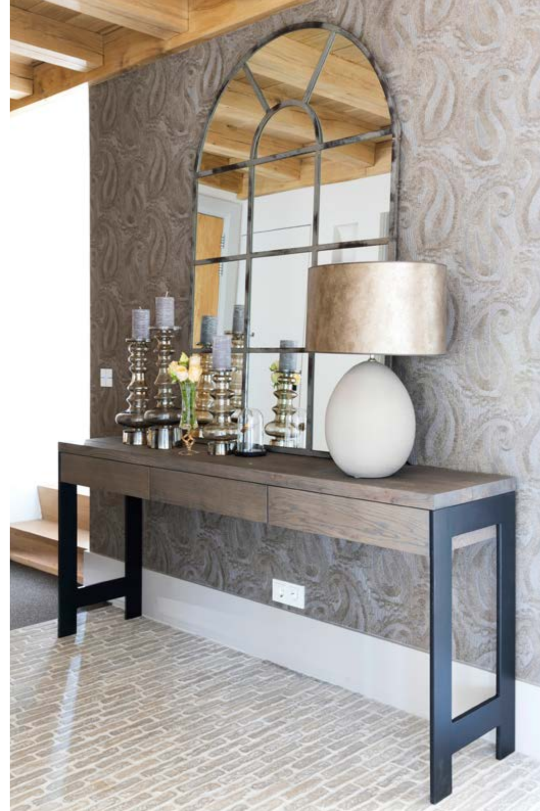
In de hal is op de muren Élitis-behang Pearles toegepast. De tafel en de glazen kandelaars zijn van MD, de lamp van Duran (alles Violier at Home). De spiegel hebben de bewoners al langer. Op de vloer liggen Castle Stones van 't Achterhuis in Udenhout. Taatsdeuren van Roukens in Elspeet bieden toegang tot de woonkamer, keuken en speelkamer. Het schilderij kochten de bewoners via Violier at Home.