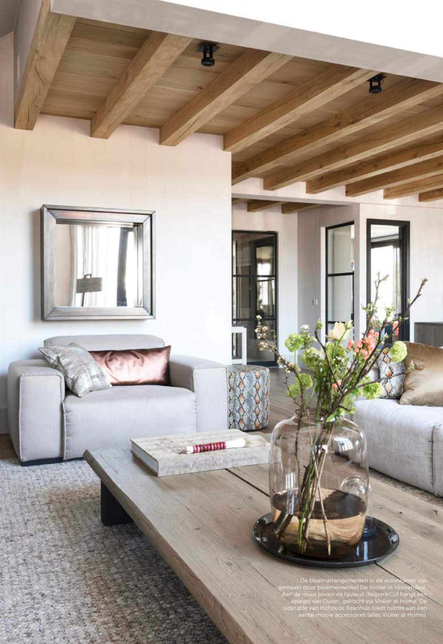
De bloemarrangementen in de woonkamer zijn gemaakt door bloemenwinkel De Violier in Veenendaal. Aan de muur boven de fauteuil (Keijser&Co) hangt een spiegel van Duran, gekocht via Violier at Home. De sidetable van Hofstede Raanhuis biedt ruimte aan een aantal mooie accessoires (alles Violier at Home).